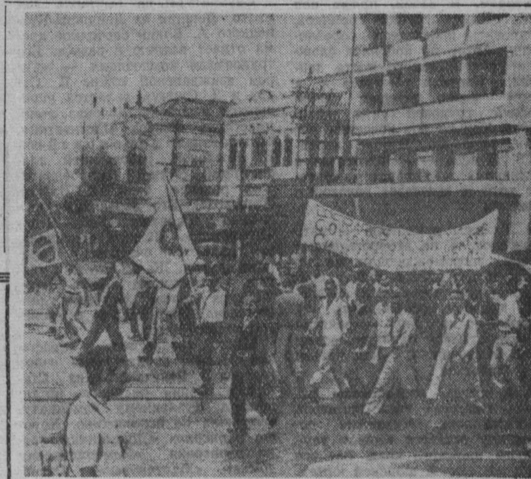
Бразилия. В столице штата Рио-де-Жанейро городе Нитерой состоялась демонстрация 1500 рабочих и служащих бразильской электромонтажной — филиала американского треста. Участники демонстрации прошли с плакатами, требующими национализации предприятия.

На падение жизненного уровня трудящихся капиталистических стран влияют также вычеты на социальное обеспечение и на пособия по безработице. Выше эти вычеты как будто и оправданы, но за ними скрывается все