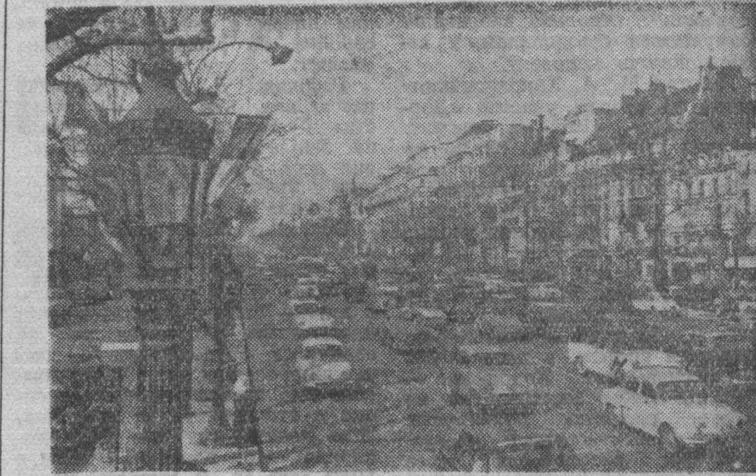
Франция. Париж. Еисейские поля.

Известный политический деятель и журналист Эрик Рамирес, касаясь заявления США о том, что они и впредь будут продолжать шпионаж, пишет в га-