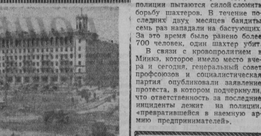
Сталинск. Площадь им. В. В. Маяковского.

КОЛОМБО, 13 мая. (ТАСС). Комментарию предстоящие переговоры на высшем уровне и инцидент с американским шпионским самолетом, нарушившим воздушное пространство СССР, газета «Форвард» пишет: «Переговоры на высшем уровне в Париже имеют прямое и жизненно важное значение для каждого человека. Они являются также важной победой концепции мирного сосуществования двух систем. Однако силы империализма не хотят отказаться от войны как средства осуществления политики, не хотят отказаться от ядерного оружия, несмотря на то, что оно угрожает человечеству полным уничтожением.» Полет шпионского самолета над Советским Союзом, предпринятый в попытке сорвать совещание на высшем уровне, указывает на газету, показывает «сколькиммерны утверждения государственного департамента о его мирных намерениях, а также, как далеко готовы пойти некоторые круги крупного капитала и военные круги Соединенных Штатов для того, чтобы не допустить ослабления международной напряженности.»