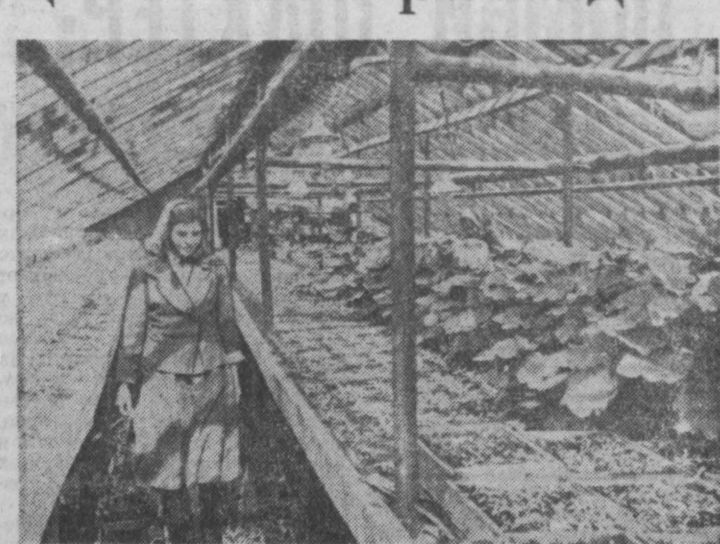
ГРЭС Мы с радостью взялись выполнять эту просьбу. На нашей фабрике цветочной рассады на полную мощность используется теплица с полезной площадью 100 квадратных метров, а также пущено в ход 300 парниковых рам...

Налтан — город пышной зелени. Такое впечатление складывается у каждого, кто придет сюда летом. В каком бы уголке здесь вы ни побывали, всюду увидите массу стройно насыщенных тоной, лил, акаций. Зеленое убранство дополняют многочисленные газоны и цветники.