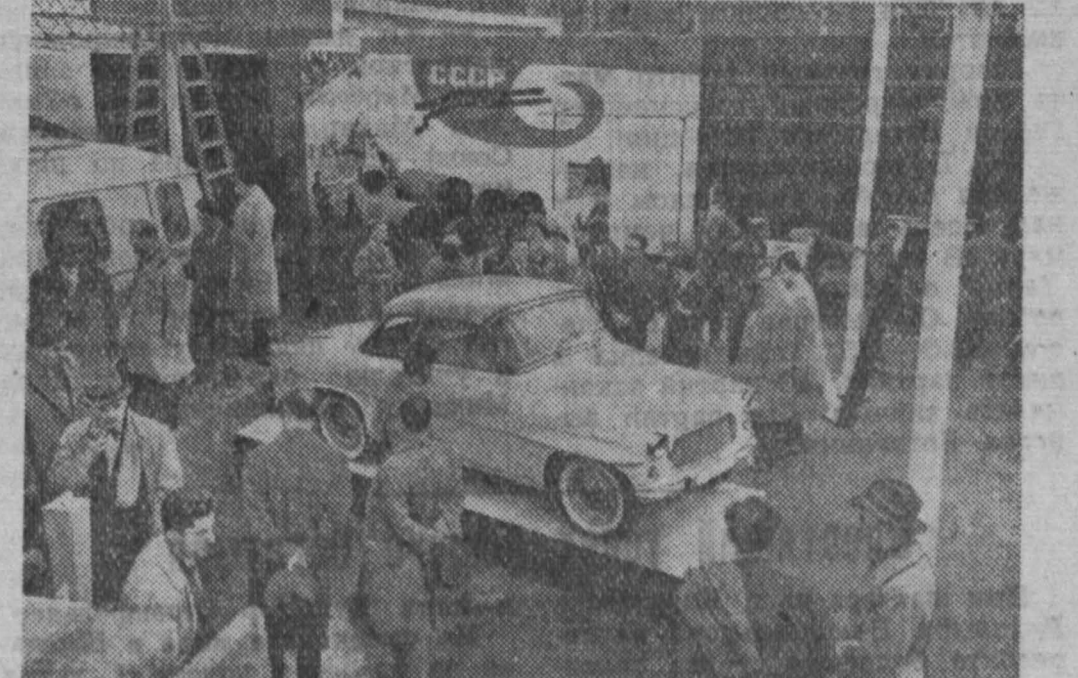
Москва. В парке культуры и отдыха «Сокольники» к 15-й годовщине освобождения Чехословакии Советской Армией открылась выставка «Чехословакия 1960 года», показывающая успехи, которых добилась страна за этот период в развитии промышленности, науки, культуры, в повышении жизненного уровня народа. На снимке: у стенда, где экспонируются чехословацкие автомобили последних моделей.

Но об этом в следующем письме. П. АНОСОВ. (Спец. корр. «Кузбасса»).