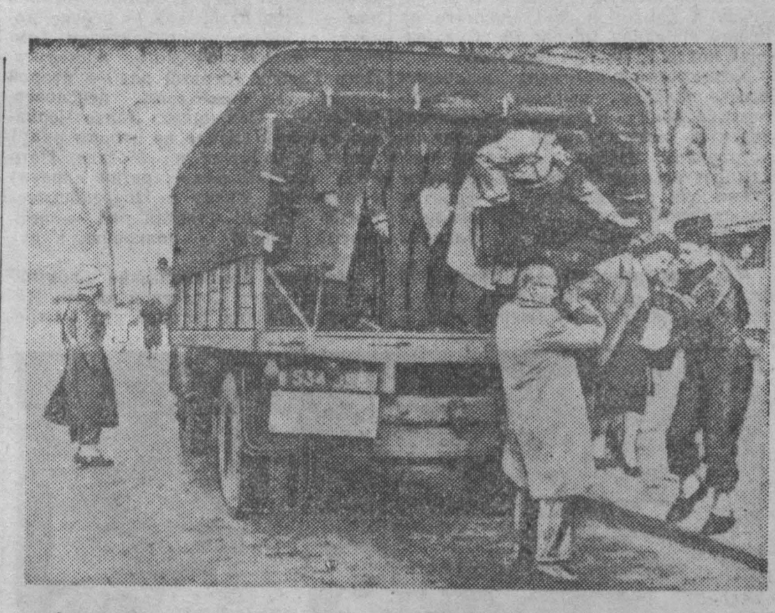
Франция. Недавно в Париже состоялась суточная забастовка водителей и кондукторов автобусного транспорта, требующих повышения заработной платы. В качестве транспорта городские власти использовали военные грузовики.

Из г. Сан-Паулу передают, что 14 апреля объявили забастовку 16 тысяч железнодорожников важнейшего сельскохозяйственного и промышленного штата Бразилии — Сан-Паулу. Бастующие требуют установления заработной платы минимум для всех рабочих-железнодорожников компании «Паудиста», обслуживающей этот штат. В ряде мест произошли столкновения между পুলিশ и пикетными забастовщиками. Для подавления забастовки мобилизованы милиция штата и войска.