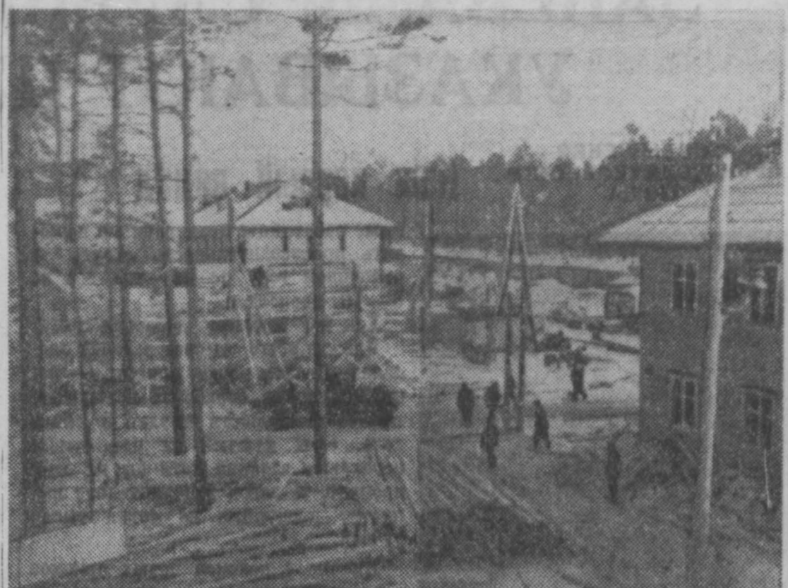
Иркутская область. В 30 километрах от Братского гидроузла в несомненной тайге началось строительство крупнейшего в стране Братского лесопромышленного комплекса, который будет ежегодно перерабатывать около четырех миллионов кубометров древесины. В состав этого комплекса войдут деревообрабатывающий комбинат с мебельными фабриками, целлюлозный завод и другие предприятия.

Все заводы и фабрики этого лесопромышленного комплекса будут работать на дешевой электроэнергии Братской ГЭС, первые турбины которой дадут промышленный ток в 1961 году.