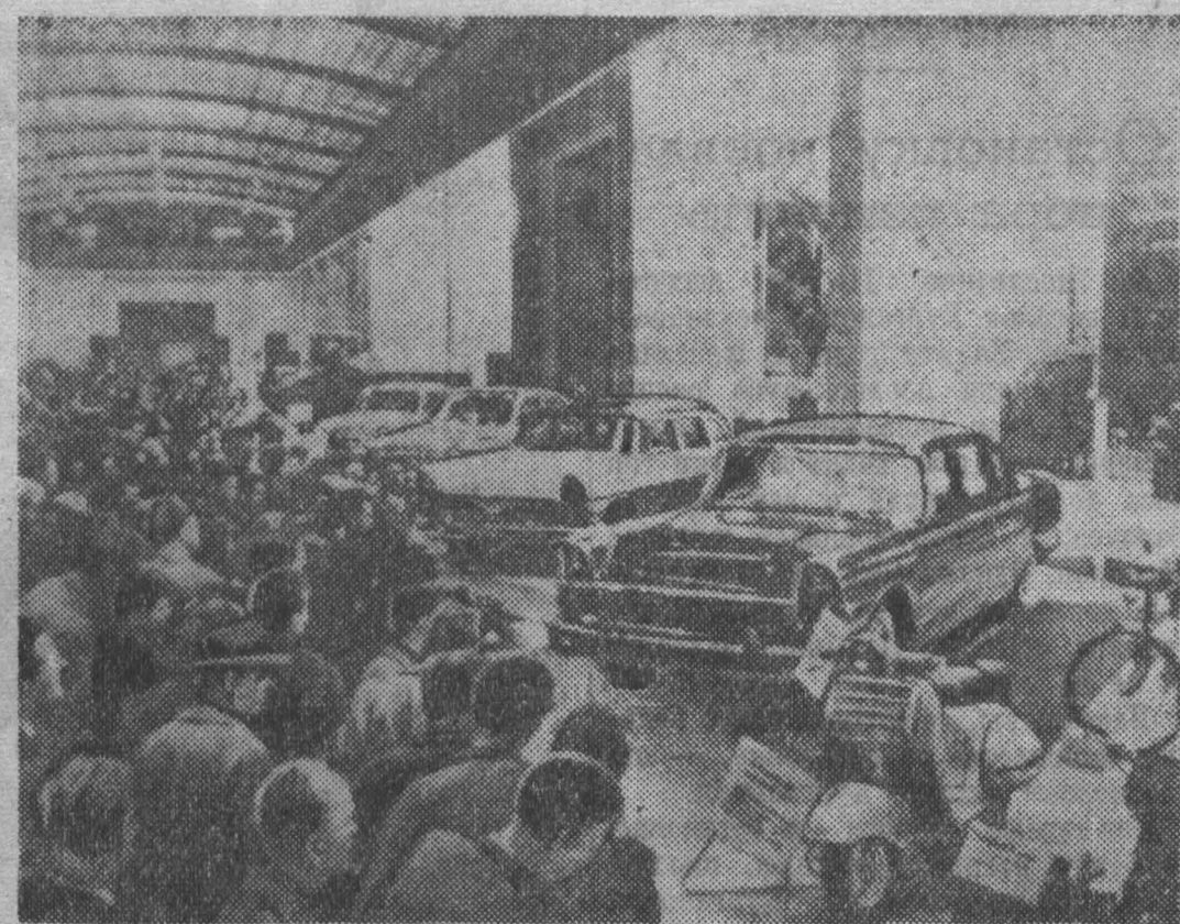
Открытие международной весенней ярмарки 1959 года в Лейпциге. НА СНИМКЕ: в павильоне Советского Союза. Посетители ярмарки у советских автомобилей.