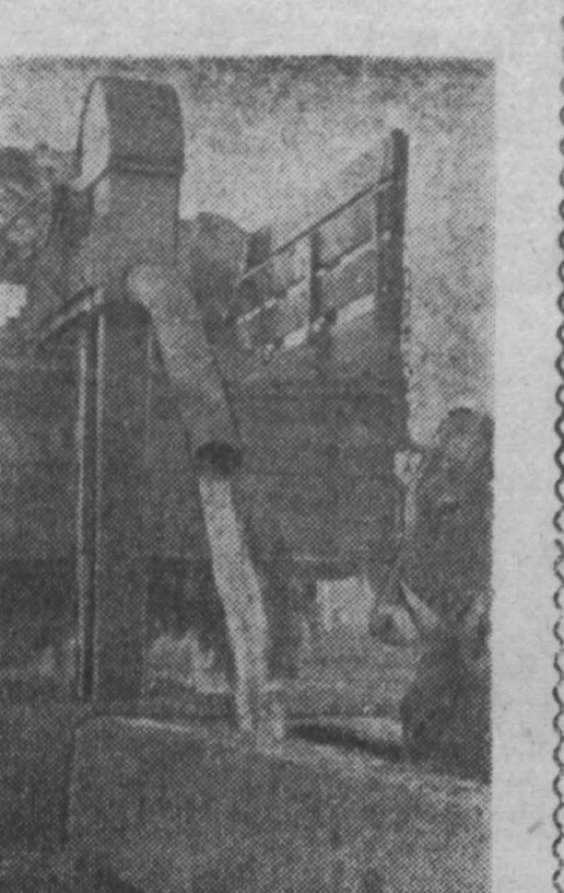
Казакская ССР. Коллектив колхозников сельхозхозяйственного колхоза «Казак»...