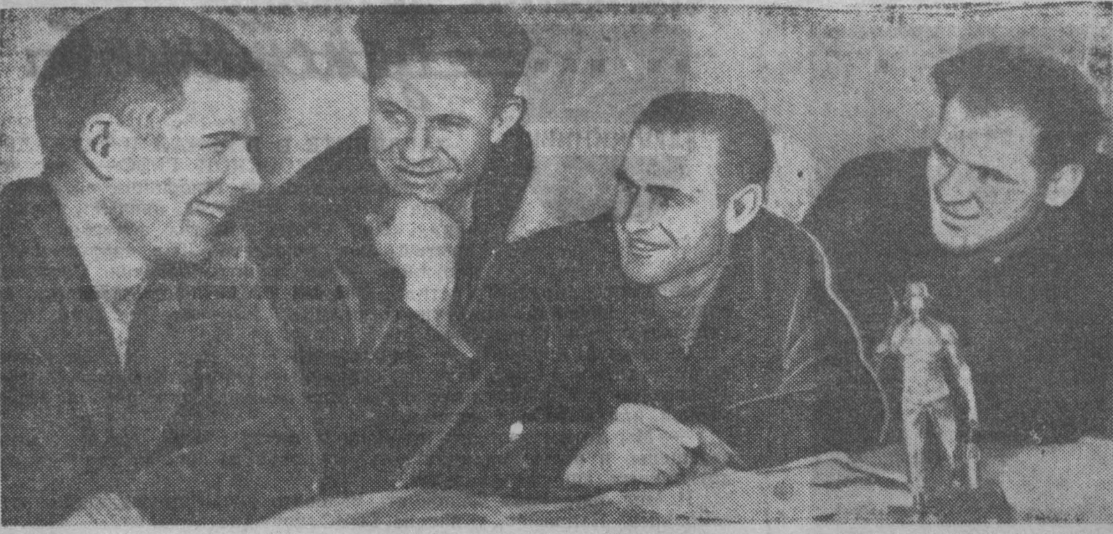
Коллектив участка № 2 шахты «Чертинская-Южная» Беловского рудника уже давно ведет переписку с горняками шахты «Зарубек» Острарского угольного бассейна Чехословакии. В знак дружбы горняки шахты «Зарубек» прислали в подарок коллективу участка № 2 бронзовую статуэтку «Шахтер с лампой».

Подакомиссия, например, установила, что выпуск лекарства корпорацией «Шеринг» обходится ей по 1,6 цента за таблетку. Однако корпорация продает эти таблетки аптекам по 17,9 цента, которые перепродают их населению по 29,8 цента за таблетку.