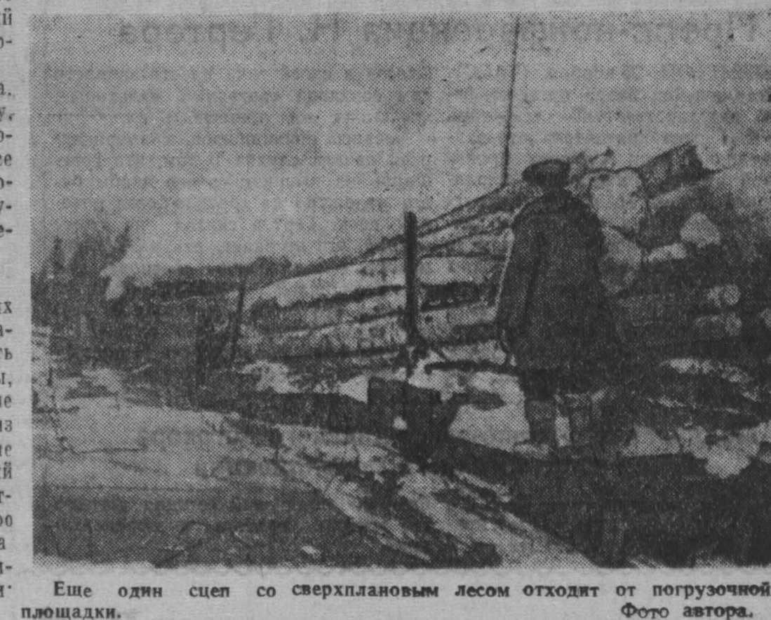
Еще один сноп со сверхплановым лесом отходит от погрузочной площадки.

В. СТРЕЛЬНИКОВ. Беляковский лесозаготовительный участок.