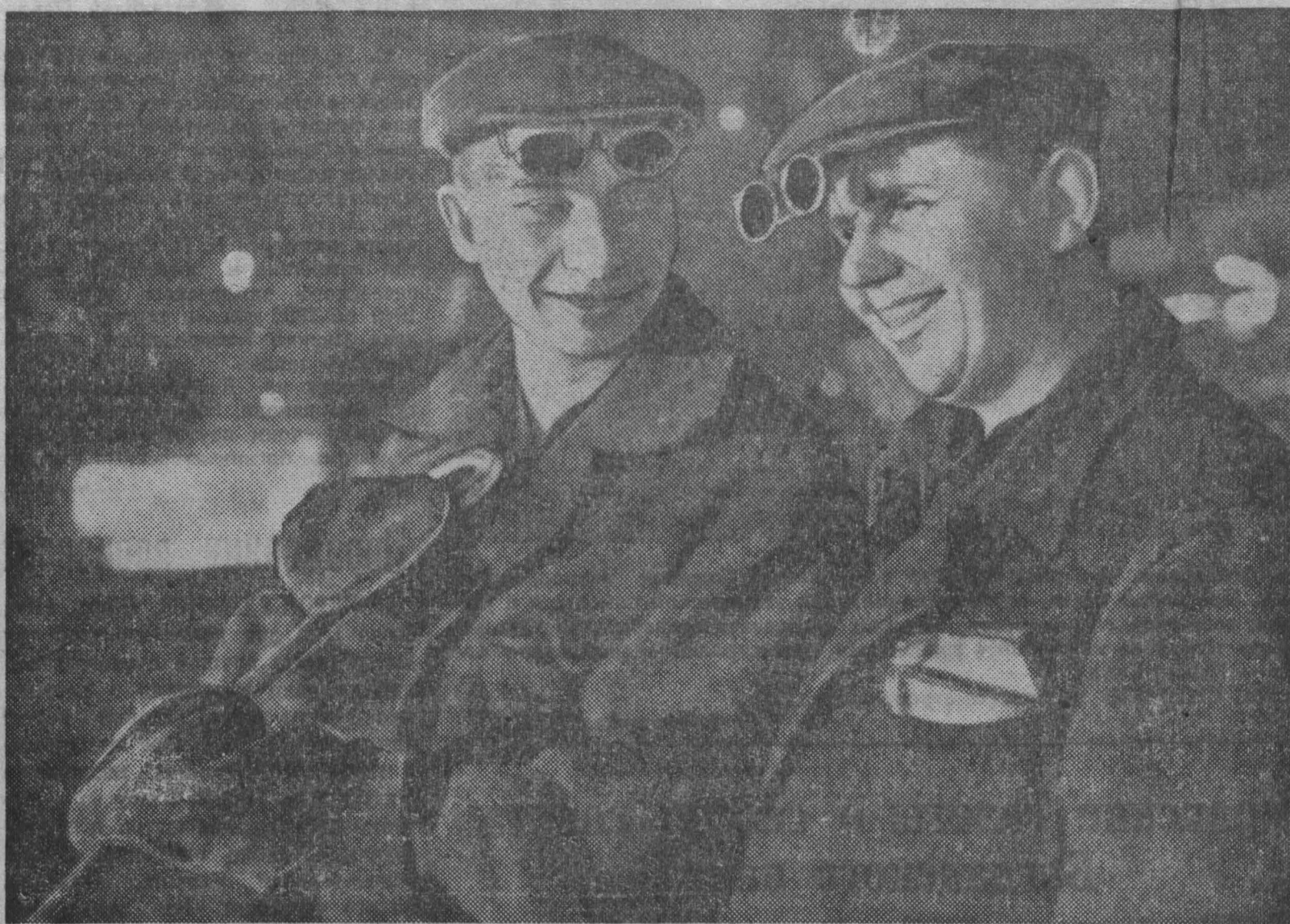
Коллектив комсомольско-молодежной печи № 9 второго мартейнского цеха Кузнецкого металлургического комбината борется за право называться бригадой коммунистического труда.

Посвящая съезду свои производственные успехи, шахтеры Прокопьевска возрождают старую традицию — зажигать в честь выполнения плана и социалистических обязательств звезды на шахтных копрах. Первыми на руднике звезду зажгли 26 января горняки «Северного Маганака». К открытию XXI съезда они закончили выполнение своего обязательства по добыче сверхпланового угля. В коллективах участков, смен и бригад раздвигаются соревнования за то, чтобы ежемесячно перевыполнять планы и обязательства, чтобы звезды на копрах шахт ярко горели весь год.