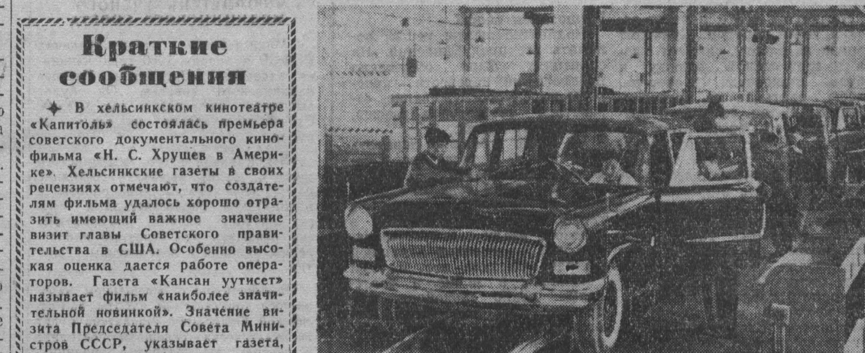
В АВГУСТЕ прошлого года на Чайновском автомобильном заводе № 1 (КНР) был создан первый образец легкового автомобиля «Хунци» (Красный флаг). В настоящее время на заводе налажен серийный выпуск седанов «Хунци». Первые 20 машин недавно были отправлены в Пекин. Шестиместный седан «Хунци» имеет современный кузов обтекаемой формы. Восемимиллиметровый мотор мощностью 210 лошадиных сил позволяет развивать скорость до 160 километров в час. НА СНИМКЕ: сборка автомобилей «Хунци».