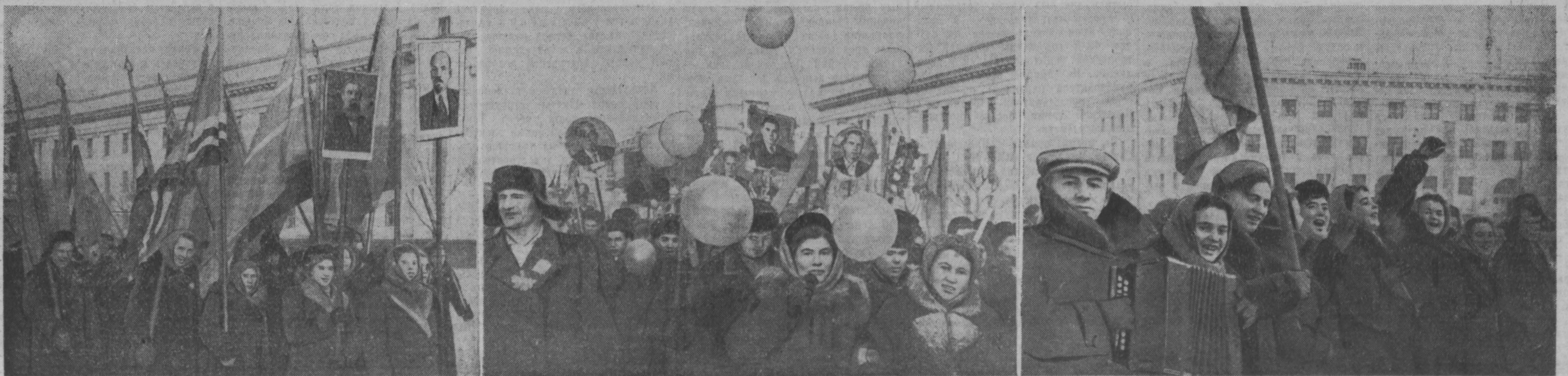
Демонстрация трудящихся 9 ноября 1959 г. в Кемерово.

знаменной ордена Ленина и ордена Суворова первой степени Военной академии имени М. В. Фрунзе. Под непрерывные аплодисменты прохо-