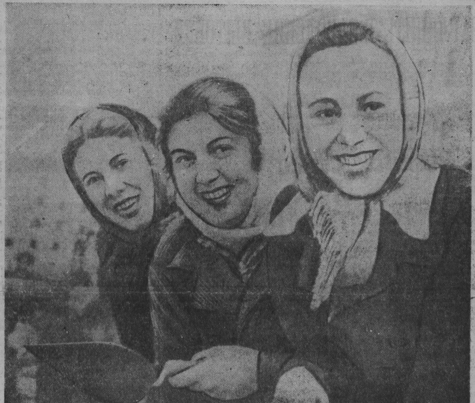
Неузнаваемо вырос молодой сибирский город Междуреченск. В новой школе-одинадцатилетке ребята успешно сочетают учебу с работой на стройке. Летом они были заняты на строительстве школьных мастерских, в которых сейчас ведут отблочные работы. Пройдет немного времени, и ребята будут приобретать трудовые навыки на больших стройках города.