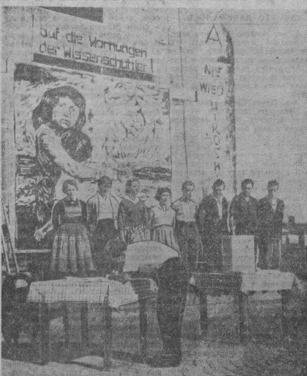
Население Западной Германии продолжает выступать против милитаризации и атомного вооружения страны. Около 6 тысяч жителей города Ремшейда (Северный Рейн-Вестфалия) в петициях в адрес бундестага потребовали немедленно прекратить атомное вооружение, а также запретить размещение и изготовление атомного оружия на территории Западной Германии.

Отвечая на американские угрозы, Фидель Кастро сказал: «Если против нас будут приняты меры, то мы предпримем необходимые контрмеры».