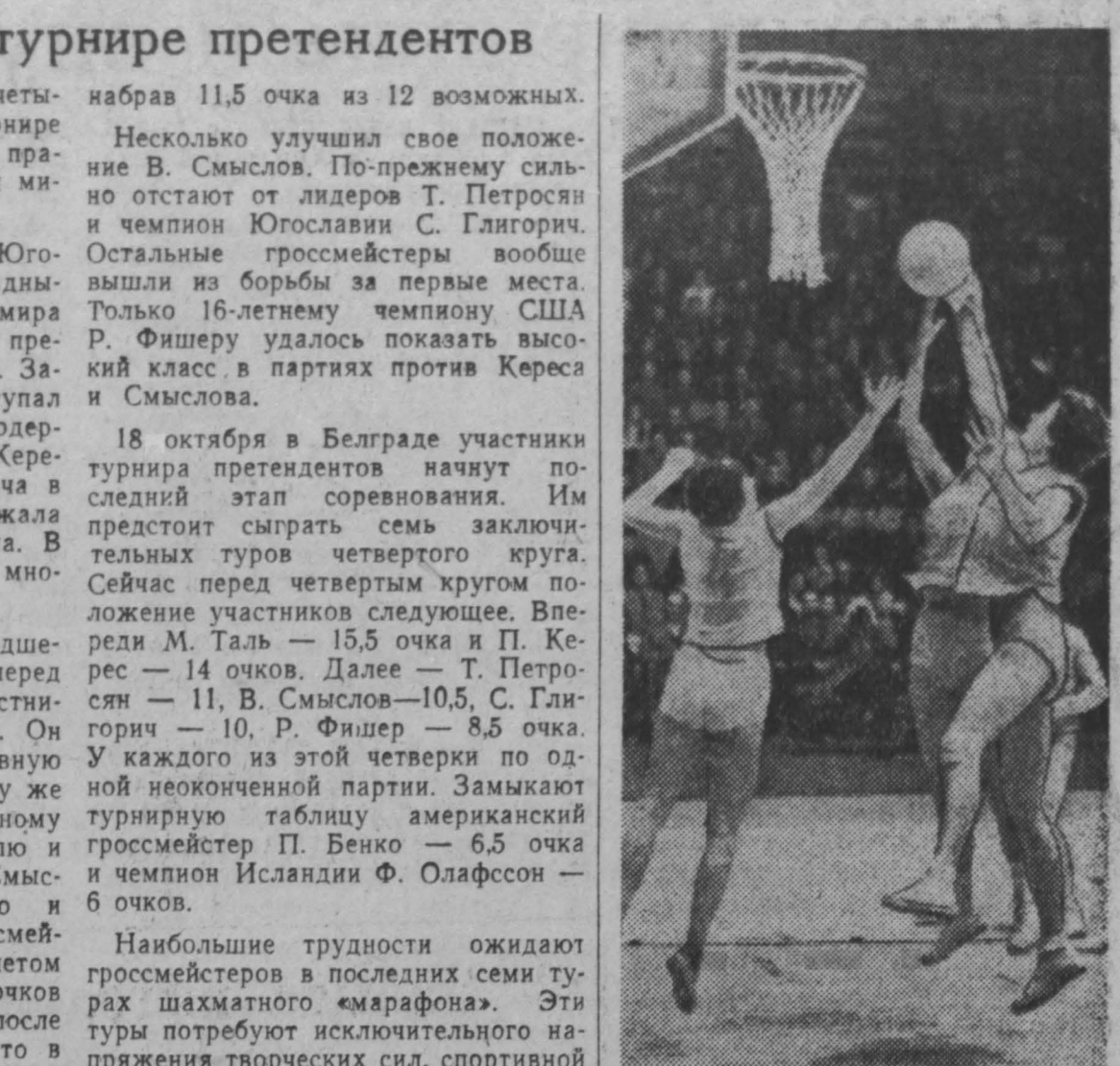
Чемпионат мира по баскетболу для женских команд

В этот вечер одна из комнат клуба киселевской шахты № 7 превратилась в уютную гостиную: мягкий свет, празднично накрыты столы, плавно льется из радиоприемника задушевная мелодия русской песни.