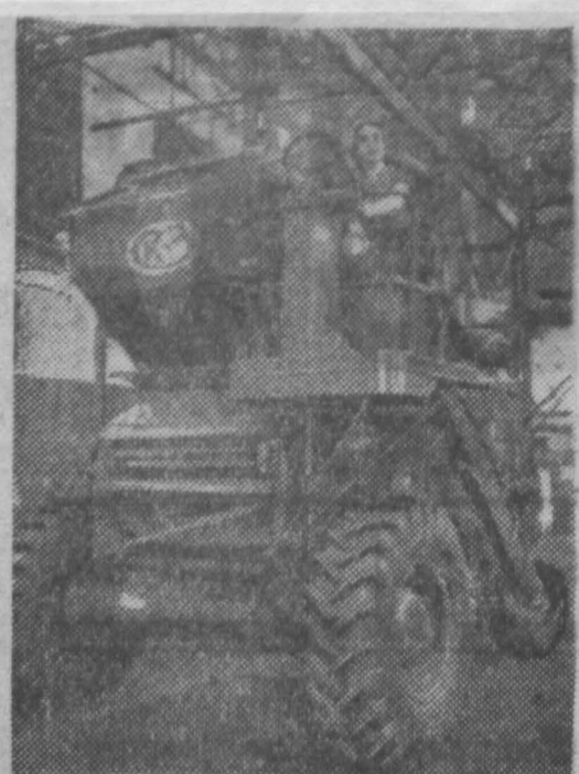
Красноярск. В этом году завод комбайнов освоил выпуск комбайнов «СК-3». Уже выпущено более 5 тысяч машин этого типа.