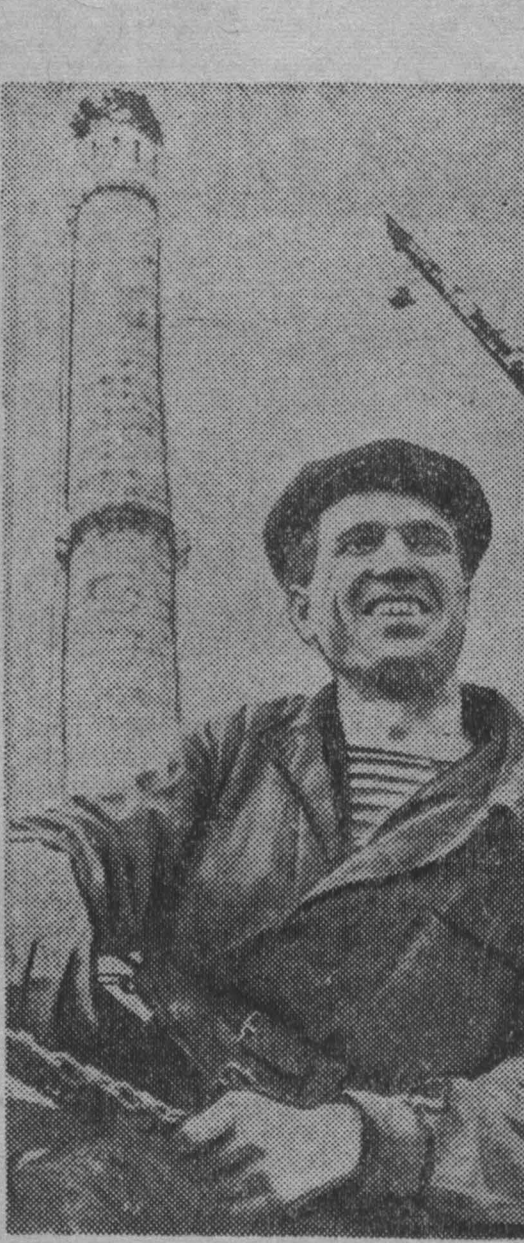
Сталиск. Много замечательных людей трудится на строительстве комплекса новой доменной печи Кузнецкого комбината.

Все представления, сделанные после этого срока, будут рассматриваться в следующей сессии вместе с материалами, представленными на соискание Ленинских премий 1961 года.