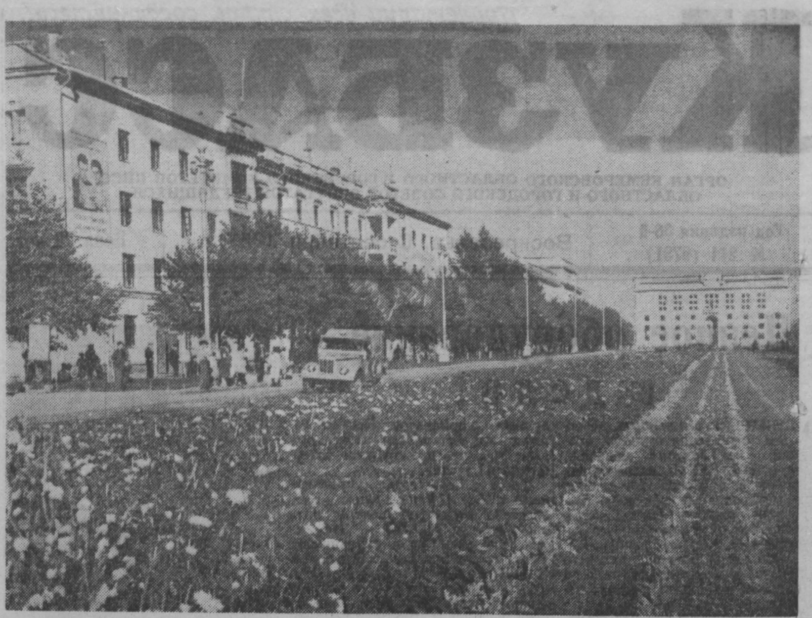
Завтрашний день на шинных заводах