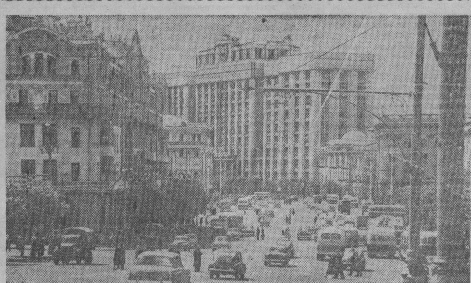
МОСКВА СЕГОДНЯ. В Театральном проезде.

Таков первый итог нашей работы. Он убедил нас, что при целенаправленной, конкретной деятельности комиссия может оказать партбюро шахты большую практическую помощь.