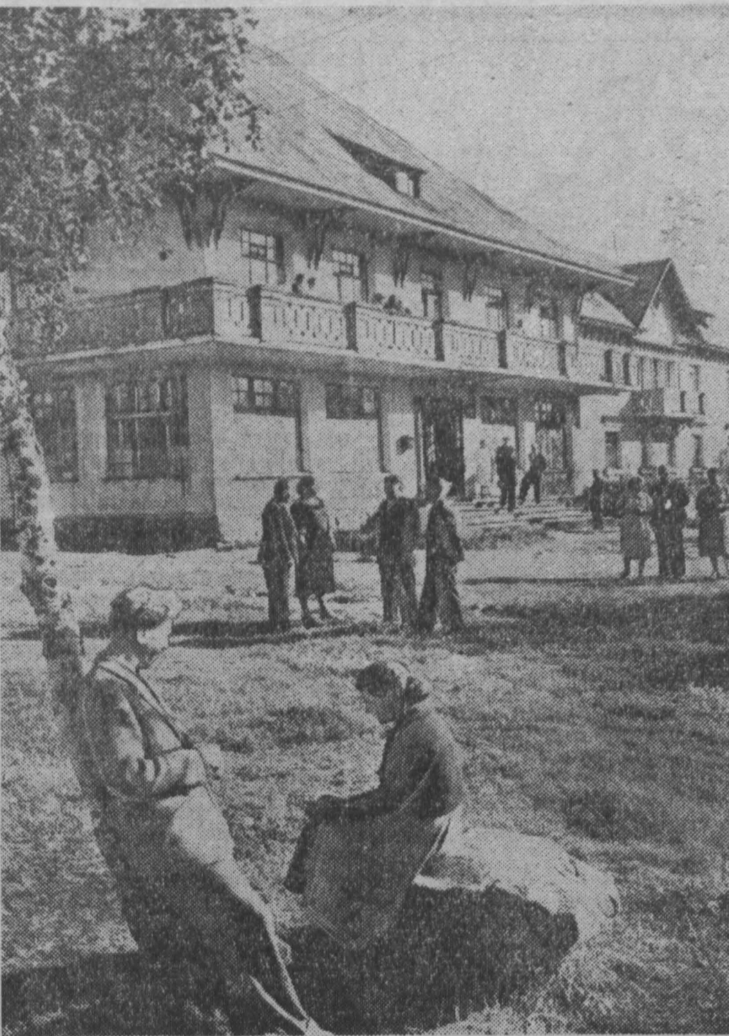
Неподалеку от Мурманска расположен самый северный советский санаторий «Мурманск». В здравнице ежегодно лечится и отдыхает свыше 1.000 человек: лесорубы, моряки, колхозники Мурманской области, а также прибывающие по путевкам из Ленинграда, Москвы, северных районов страны.