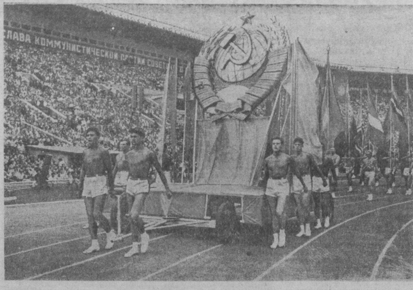
Москва, 8 августа на Центральном стадионе имени В. И. Ленина состоялся праздник открытия II Спартакиады народов СССР.