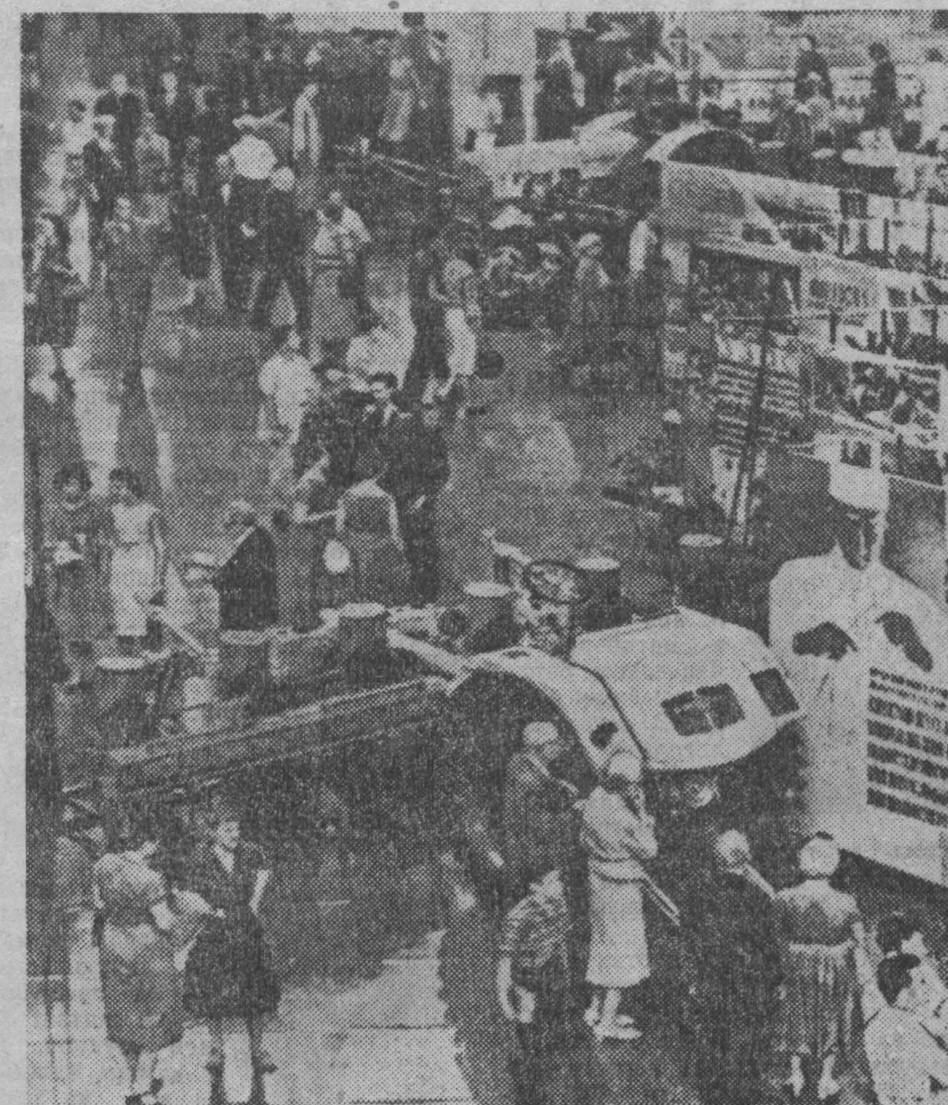
Советская выставка в Нью-Йорке. В отделе сельскохозяйственных машин.