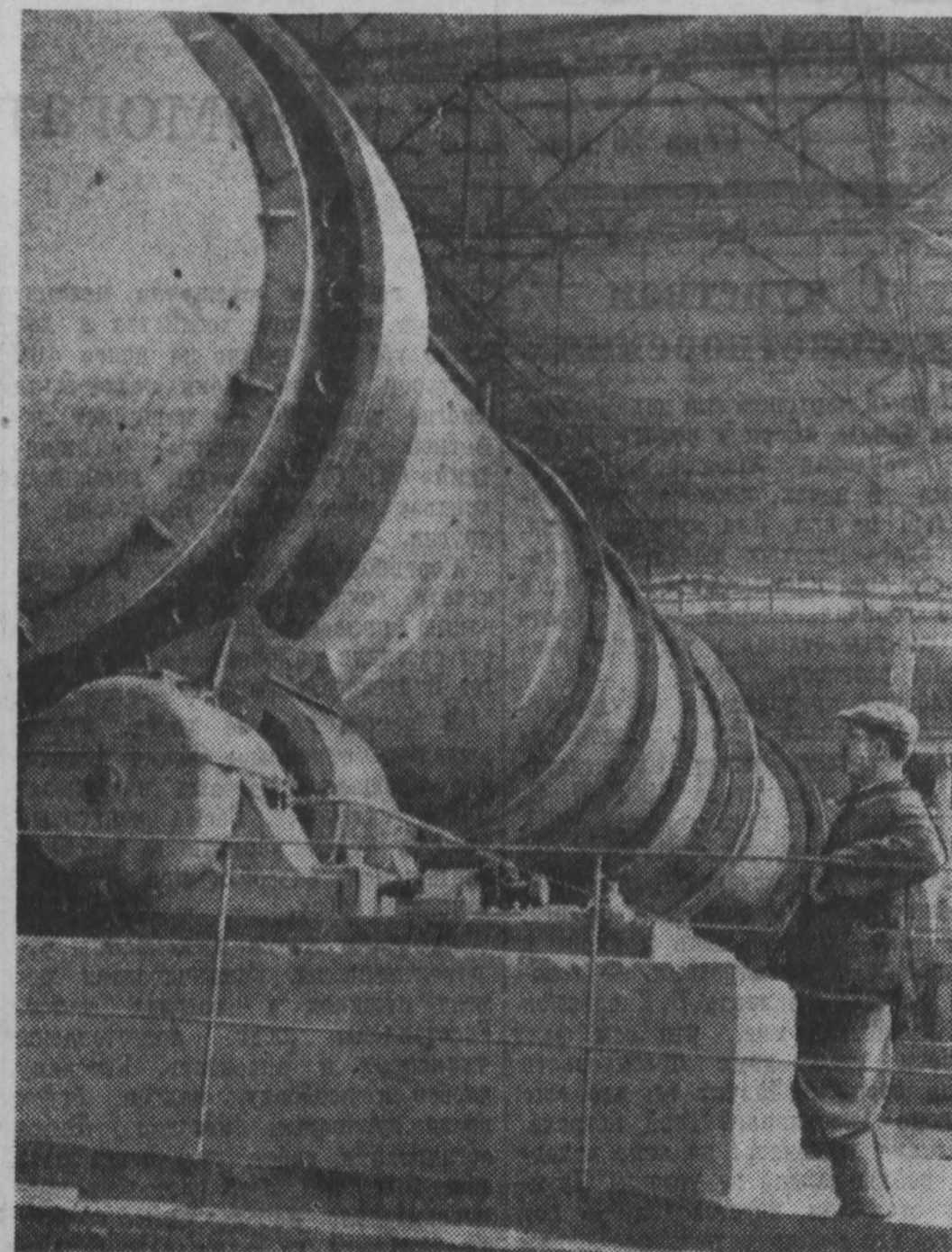
Недавно на цементном заводе в г. Яшино сдана в эксплуатацию новая крупная вращающаяся печь. В ближайшее время предполагается сдать еще одну такую же печь.

НА СНИМКЕ: новая вращающаяся печь.