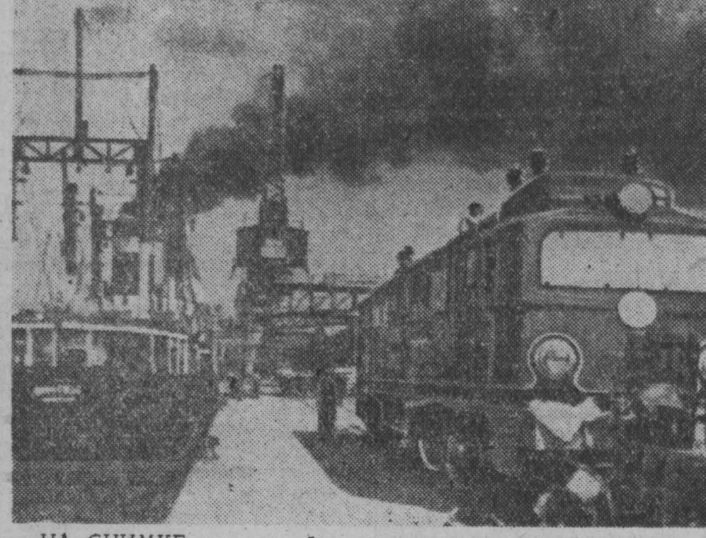
На снимке: импортный электровоз, предназначенный для Красноярской дороги, на причале Ленинградского порта.

М. ПИЛЬЧИКОВ, корреспондент газеты «Советская Балтика».