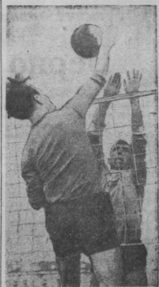
Позавчера в Кемерово закончилась спартакиада работников химической промышленности...