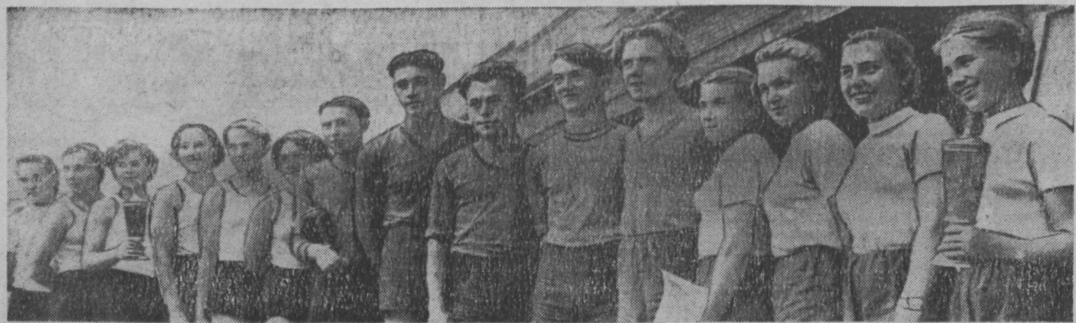
Выступлениями легкоатлетов, волейболистов и футболистов завершается спартакиада сельских физкультурников Кузбасса. И сборных команд районов и восьми коллективов физкультуры оспаривали право на получение переходящего приза по легкой атлетике. Когда был поведен этот первого дня соревнований, одинаковое количество очков набрали команды Промышленновского и Кемеровского районов.

«Химик». Преимущество по-прежнему было на стороне хорошо подготовленных спортсменов Кемеровского района. Они и победили, как мужская, так и женская команды.