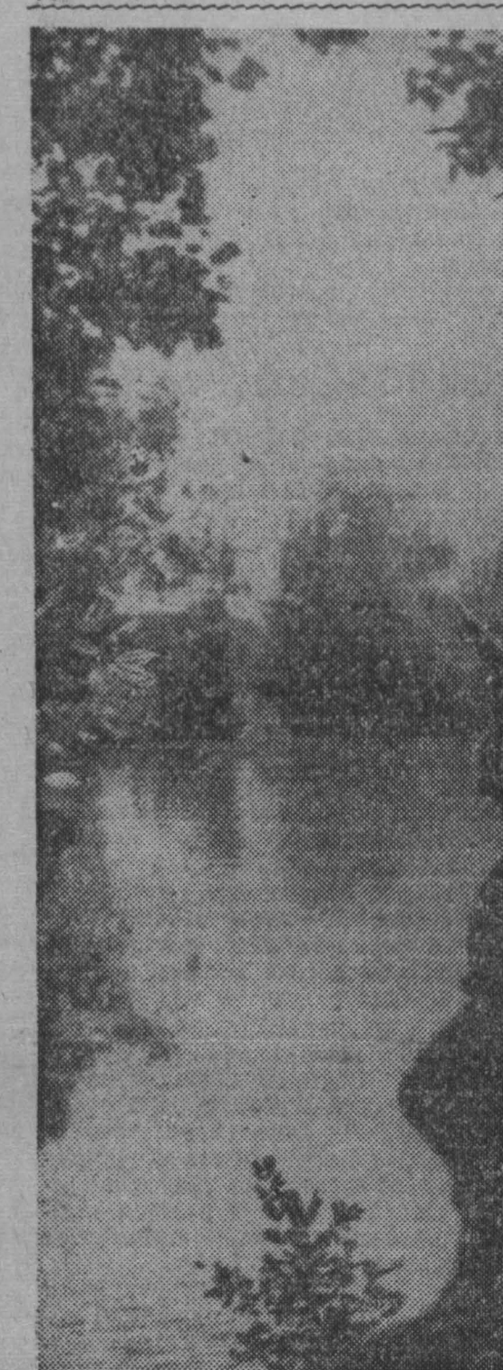
НА РЕКЕ.

не последуете ли вы примеру Омска? А. БЕЗЫМЕНСКИЙ же избранный населения квартала, составляющие ядро квартала. Каждый из пятиот комитета создал соборные жители своего квартала. С докладными выступили депутаты горсовета. Решающее горкома партии и исполкома встречено было горячим одобрением. И вот горячане начали поход за чистоту. В борьбу против грязи включились полторы тысячи врачей, три тысячи средних медицинских работников и три тысячи студентов медицинского института. Они обследовали санитарное состояние квартир, дворов, учреждений. Собрались посоветоваться и дворники Омска. Зам. председателя горисполкома Г. Мильчаков сделал доклад «Чтого хотят от дворников жители города». В конце собрания лучшим дворникам выдали денежные премии и ценные подарки. Работники просвещения, редакторы всех многотиражек, выходящих в Омске, профессора институтов — весь город пошел в наступление на грязь. Но все рекорды активности показали школьники. 37-я и 80-я школы Омска обратились ко всем ученикам с призывом включиться в поход против грязи и мусора, добывать образцов санитарного состояния в школе и дома, принимать участие в очистке и озеленении города. Школьники Омска организовали санитарные посты в кварталах, обходили участки и дома, заглядывали в самые потайные уголки дворов и квартир. Они вели вежливый разговор с