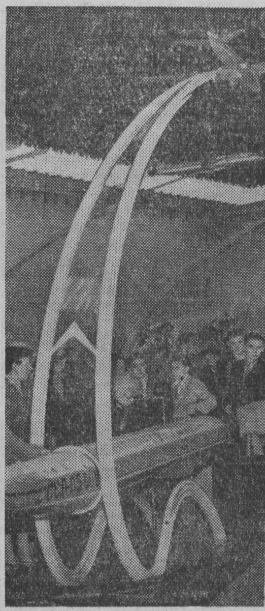
Выставка достижений народного хозяйства СССР. В павильоне «Транспорт СССР», посетители осматривают модели самолетов.

Вперед! Большая работа. За дело, товарищи шахтеры! Сделаем наши угольные предприятия безубыточными!