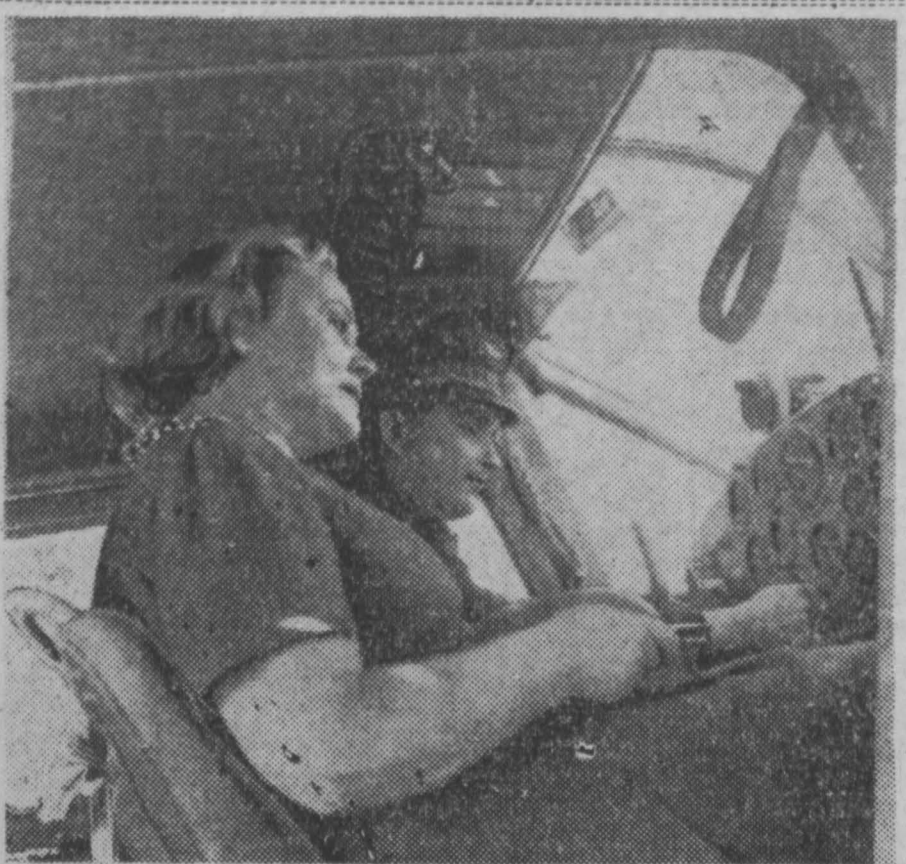
Внизу промывают города и поселки. Скорее, скорее к больному! Врачи и пилот спешат в Таштагол.