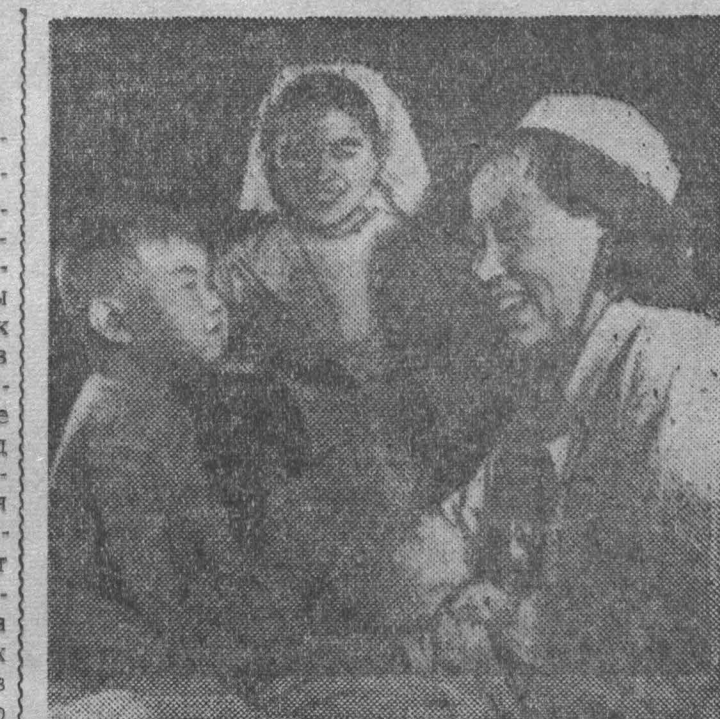
Корейская Народно-Демократическая Республика. В амбулатории Пхеньянского текстильного комбината.

Аме. металлурги по профессии, сказал Ф. Р. Козлов, было особенно