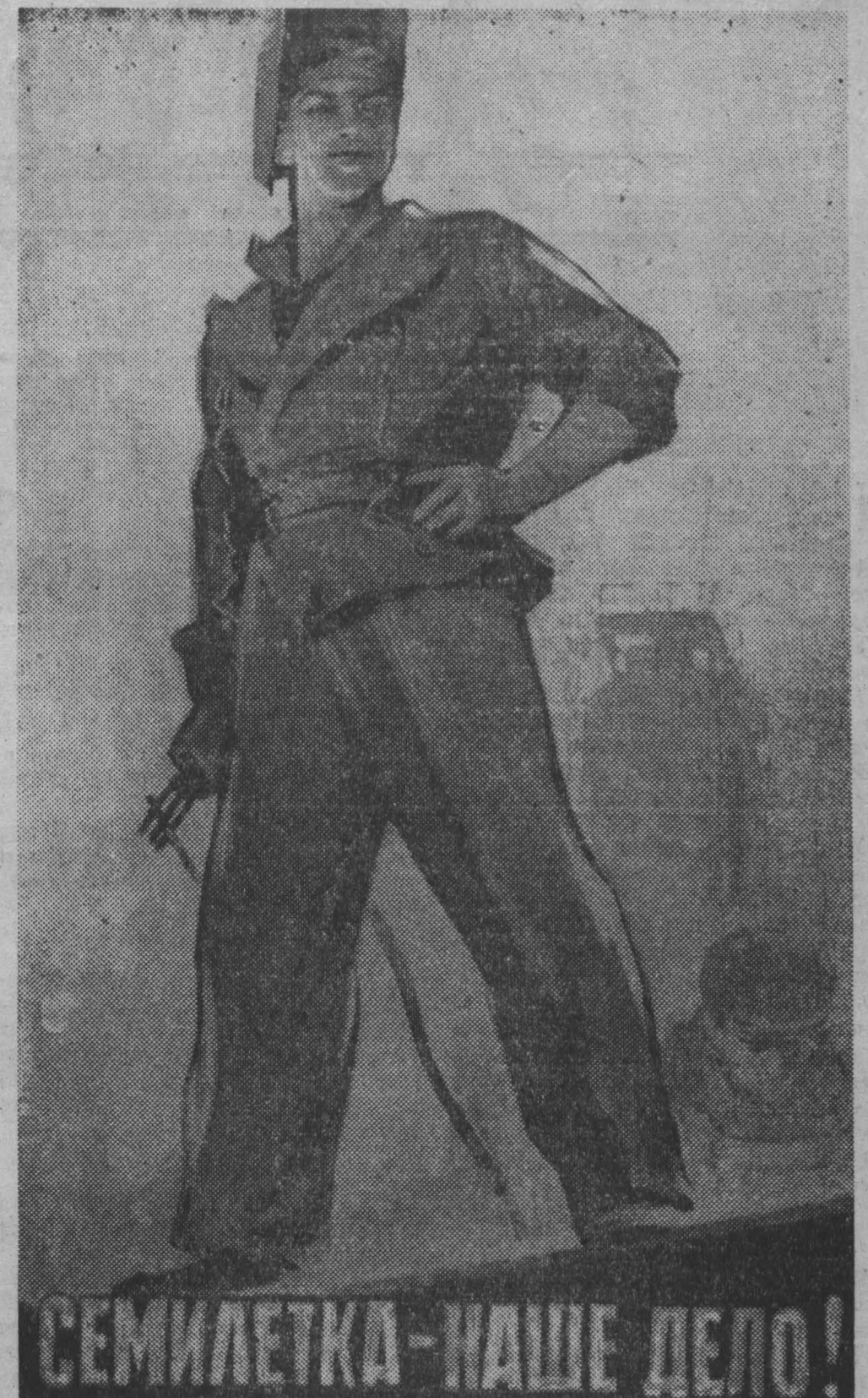
Плакат художника В. Сачкова, выпущенный Государственным издательством изобразительного искусства.

Митинги и собрания по обсуждению итогов Пленума ЦК КПСС прошли также на крупнейшем угольном предприятии — шахте № 9-15, на шахтах № 2 и «Физкультурник». Всюду рабочие пересматривают свои обязательства и с новой силой развертывают соревнование за досрочное выполнение плана текущего года.