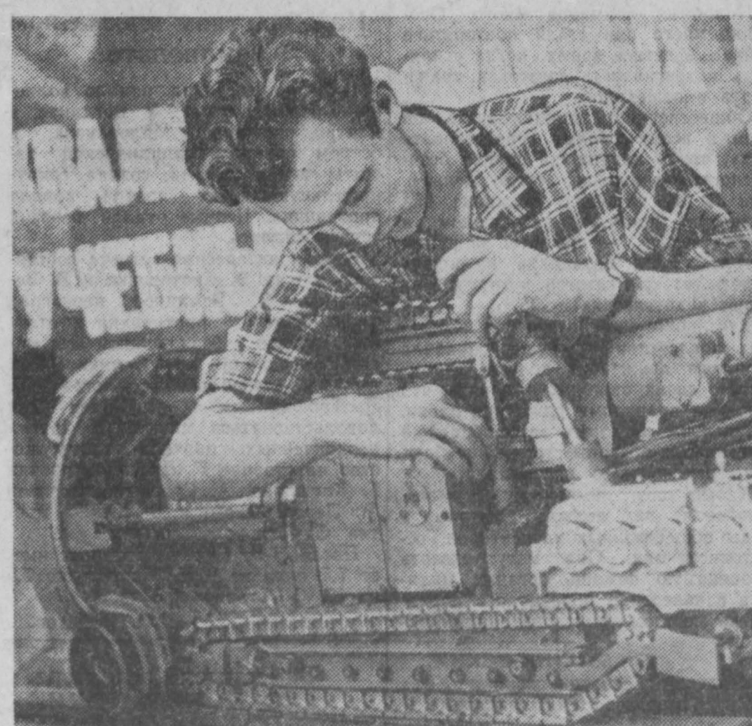
Юные техники г. Прокопьевска изготовили для Выставки достижений народного хозяйства СССР действующую модель проходческого комбайна Я. Гумениака. НА СНИМКЕ: модель комбайна.