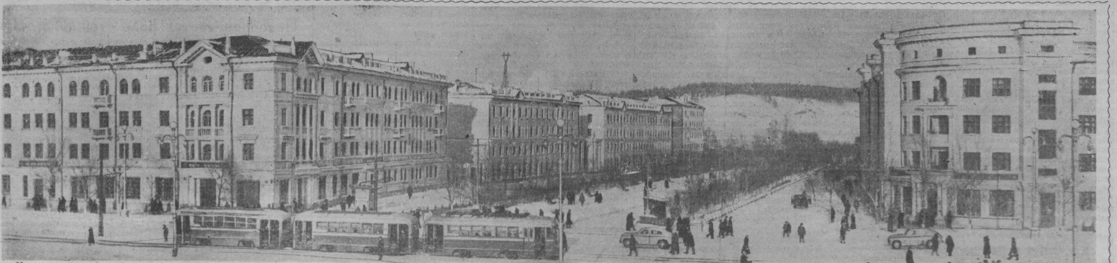
Кемерово. Зимой на Весенней улице.