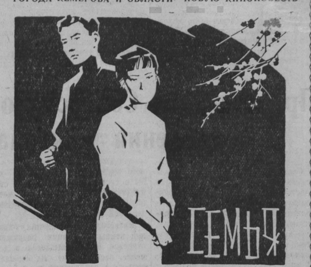
(по роману Ба Цзиня).

Автор сценария Чэнь Си-хэ, Режиссеры Чэнь Си-хэ, Е Мин, оператор Суй Ци, композиторы Хуан Чжун, Люй Ци-мин, художник Ли Чань. Роли исполняют: Вэй Хао-ли, Сунь Да-линь и другие. Производство Шанхайской киностудии. Фильм дублирован на киностудии имени М. Горького. Режиссер дубляжа А. Золотницкий, звукооператор А. Беляев.