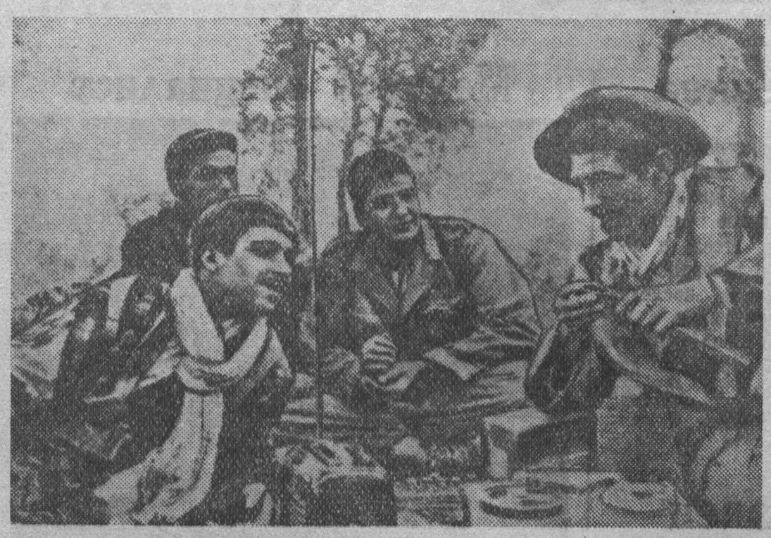
К событиям в Алжире. НА СНИМКЕ: группа бойцов освободительной армии Алжира.