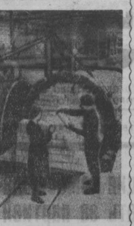
Латвийская ССР. Слан в эксплуатации Даугавпилсский завод силикатного кирпича. Он построен за 7 месяцев.

Основной порок догматиков состоит в том, что они заучивают отдельные формулы и положения марксизма и рассматривают их в отрыве от практики.