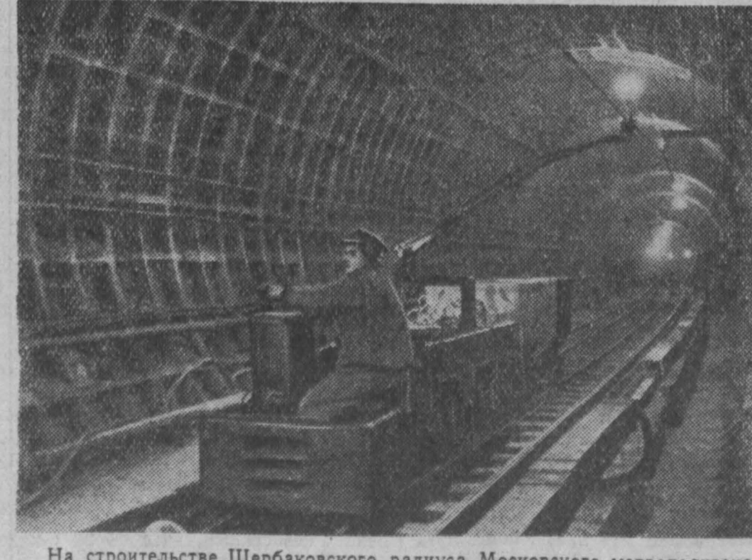
На строительстве Шербаковского радиуса Московского метрополитана имени В. И. Ленина закончилось сооружение основных конструкций четырех подземных станций — «Ботанический сад», «Рижская», «Шербаковская» и «СВХВ». Протяженность новой линии около шести километров. НА СНИМКЕ: однострунный тоннель на перегоне между станциями «Рижская» — «Ботанический сад».

Следующее заседание съезда состоится 16 апреля. (ТАСС).