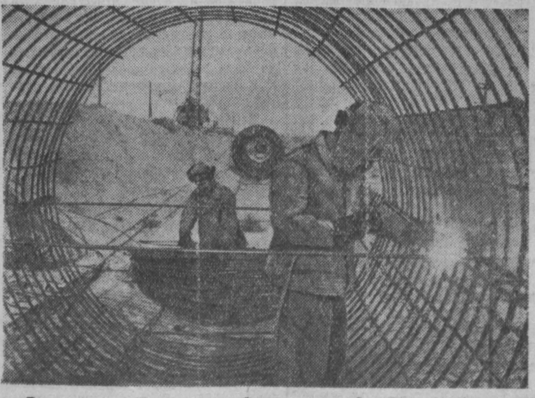
Таджикская ССР. На левом берегу реки Сыр-Дария сооружается Ходжа-Бакирганская насосная станция, которая позволит оросить несколько тысяч гектаров вновь осваиваемых целинных земель. Строители станции обязались дать воду в апреле текущего года. НА СНИМКЕ: монтаж каркаса трубопровода Ходжа-Бакирганской насосной станции.