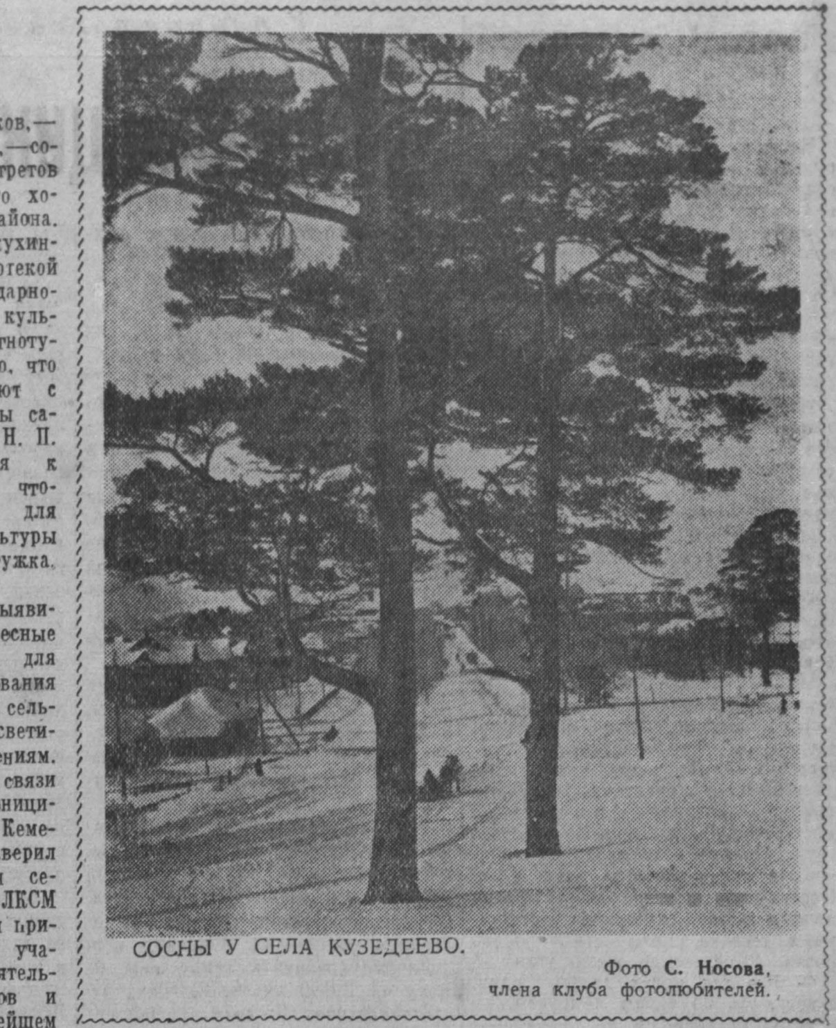
СОСНЫ У СЕЛА КУЗДЕЕВО.