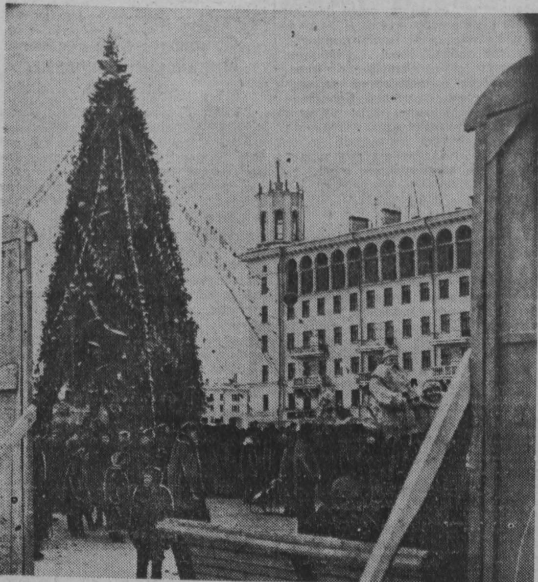
В центре города Сталинска в дни школьных каникул для ребят установлена большая и нарядная новогодняя елка.