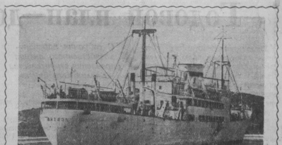
Из дальнего плавания в центральной части Тихого океана во Владивосток вернулся «Витязь» — экспедиционное судно Института океанологии Академии наук СССР. За 115 дней плавания «Витязь» прошел более 17 тысяч миль.