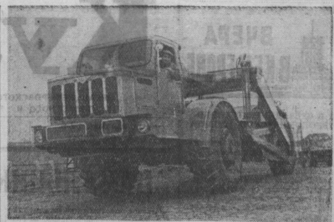
Николаев. «Сделано в СССР». Самоходный скрепер «Д-357Г» 10 м 3 . 1958 г. Такую модель можно увидеть на машине, изготовленной заводом «Дор-машин» и предназначенной для отправки в Брюссель на Всемирную выставку. Самоходный скрепер марки «Д-357Г» создан на базе автомобиля Минского автозавода. Кош скрепера емкостью 10 кубометров имеет ширину захвата 2,78 метра. Машина может транспортировать грунт на расстоянии от 800 до 5.000 метров. НА СНИМКЕ: самоходный скрепер «Д-357Г» перед отправкой на Всемирную выставку в Брюссель.

В Гурьевске, по улице Ленина, есть промтоварный магазин № 10. Когда проходил мимо него, всегда слышим веселую музыку, хорошие песни. Не если вы зайдете в магазин и попросите продавца продать граммпластинку, вам ответят, что в продаже их нет. Нет в продаже и ламп к радиоприемникам, корундовых игл, электротугов. Работникам торговли следует лучше заботиться об удовлетворении культурных и бытовых запросов трудящихся. А. БАЙДИН.