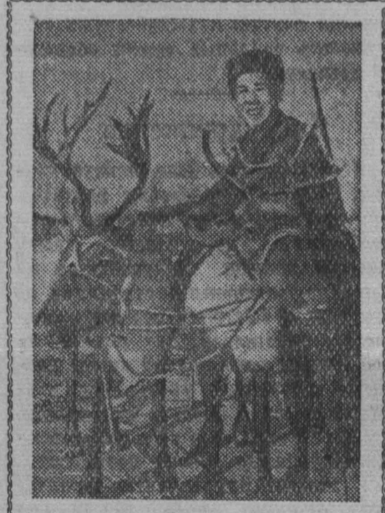
На севере Хабаровского края, в Верхне-Бурейском районе, водятся много соболей ценной породы, обладающих красивым шелковистым мехом. Охотники ведут олов этих зверьков и сдают их в Верхне-Бурейский племенной соболятник рассадник, который направляет зверьков в районы Дальнего Востока и Сибири.