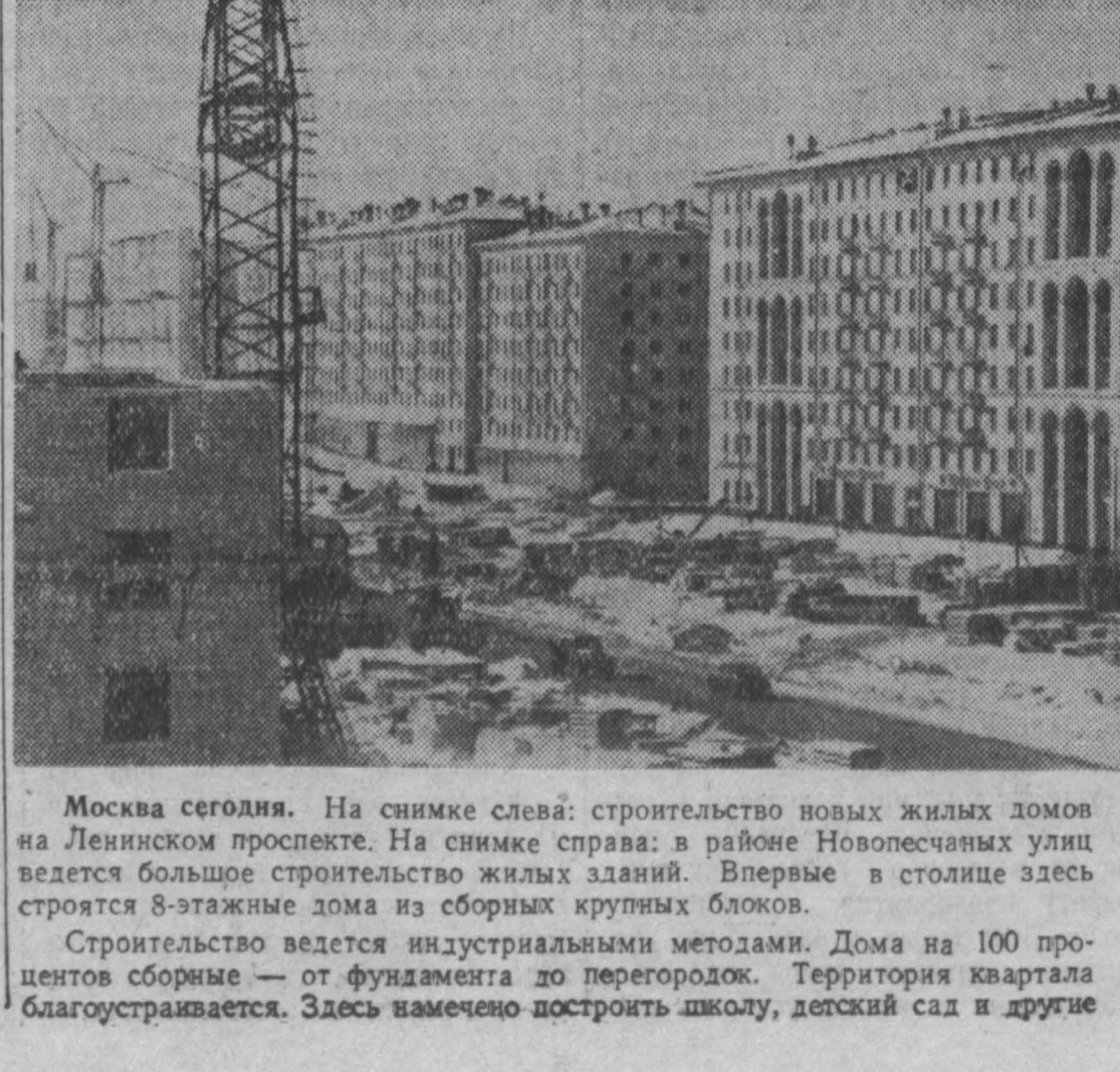
Москва сегодня. На снимке слева: строительство новых жилых домов на Ленинском проспекте. На снимке справа: в районе Новосельских улиц ведется большое строительство жилых зданий. Впервые в столице здесь строятся 8-этажные дома из сборных крупных блоков. Строительство ведется индустриальными методами. Дома на 100 процентов собираются — от фундамента до перегородок. Территория квартала благоустраивается. Здесь намечено построить школу, детский сад и другие культурно-бытовые учреждения. Строительство ведется по проекту магистральной мастерской № 5 института «Моспроект». На снимке видна система Д. Л. ЛУКИНА (справа) и горельсника Н. С. КИСЕНКОВА, систематически выполняющих сменные нормы на 170—180 процентов, на строительстве жилых домов на 1-й Хорошевской улице.