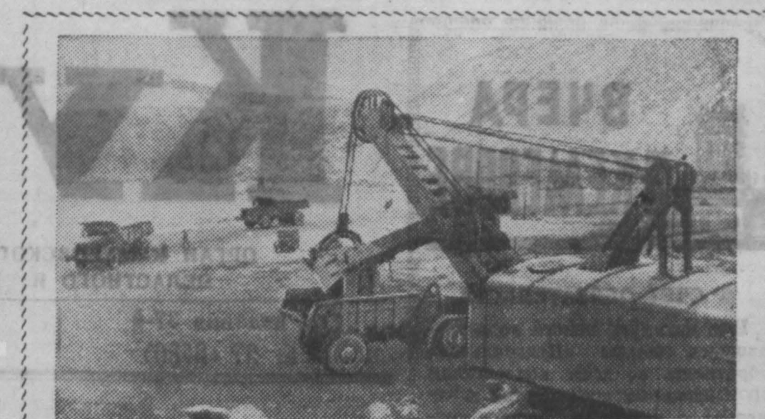
Ростовская область. На фоне неба на высокой насыпи силуэтом рисуется уходящий поезд. На столбе четко выведена цифра «91». Это 91-й километр железнодорожного пути от станции Лихая до Сталинграда. Отсюда раскрывается широкая панорама поселка с ровными улицами и множеством домов. Вдали видны сооружения шебеновых заводов, обогатительной фабрики, а справа широким фронтом раскинулись разработки богатых залежей строительного камня. Здесь расположено Жирновское карьероуправление. Оно занимается разработкой нерудных строительных материалов. Составы с щебнем отправляются отсюда на строительство Сталинградской ГЭС, линии электропередачи Сталинград — Москва и на другие объекты. Жирновское карьероуправление успешно выполняет план. На СНИМКЕ: в карьере. Погрузка камня в автомашину для переработки на шебеновых заводах.

Все ремонтники за любую работу получают повременную оплату. Сколько бы ни сделал рабочий, он получает тарифную ставку по своему разряду. Вот и работают люди как кому вздумается. Странно, что трест совхозов урса совхоза мнит себя с таким положением в совхозе. С. Сантьев.