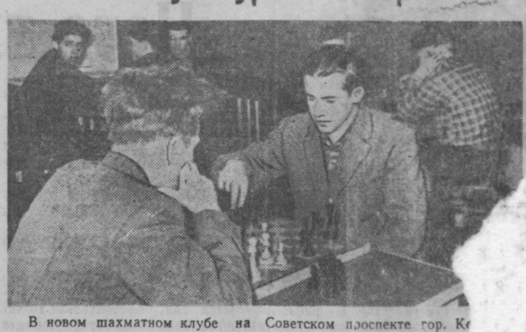
В новом шахматном клубе на Советском проспекте гор. Кемерово.