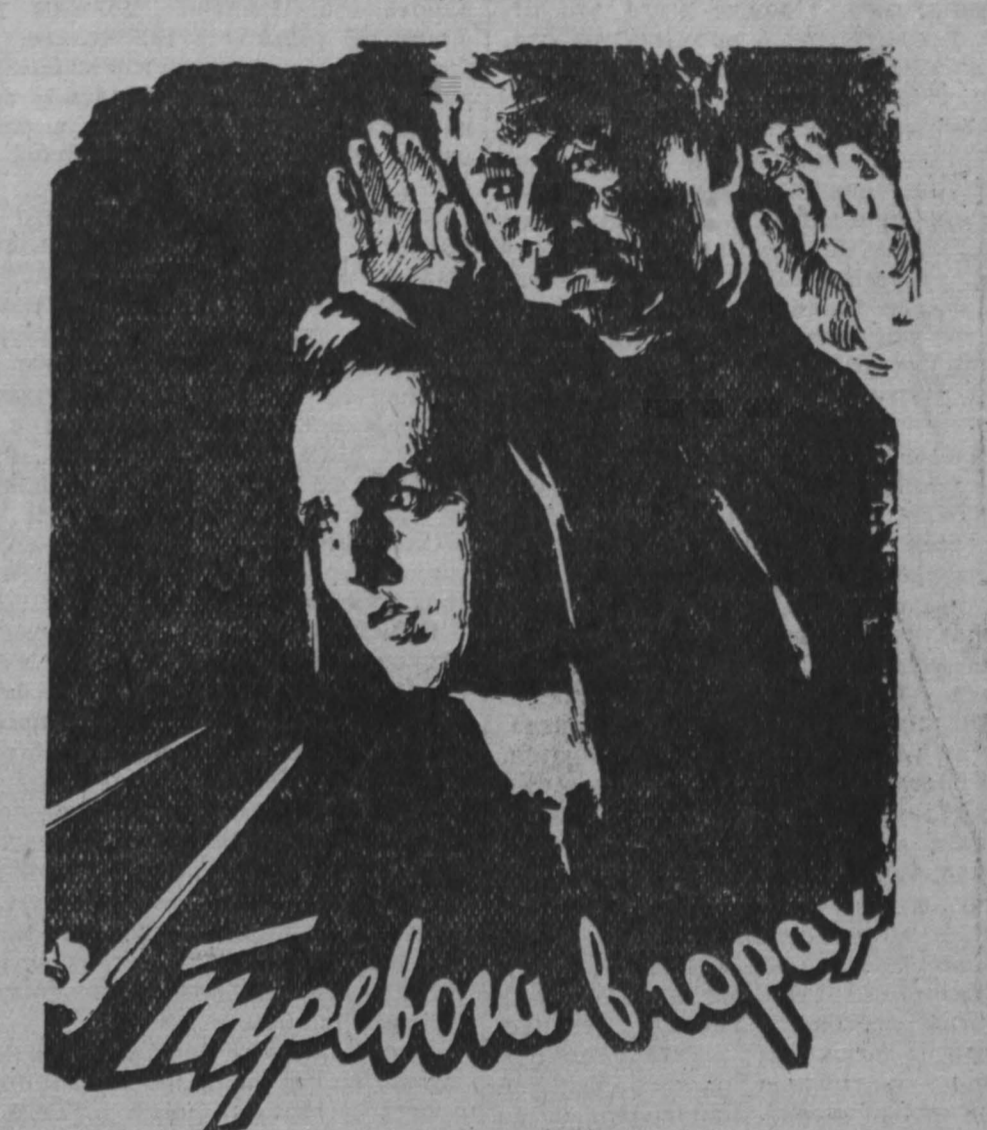
Автор сценария П. Лускалов, режиссер Дину Негряну, оператор А. Рошину, художник И. Орович, композитор Э. Косма, звукооператор И. Илюску.

К сведению руководителей предприятий, организаций и библиотек! Кемеровский областной библиотечный коллектор и его филиалы в гг. Сталинске и Прокопьевске ЗАКЛЮЧАЮТ ДОГОВОРЫ НА 1958 ГОД НА КОМПЛЕКТОВАНИЕ