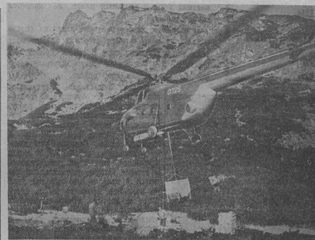
Чехословацкая Республика. В Высоких Татрах проводится электрификация домов отдаленных и санаториев. Большую помощь оказывают монтажники и строители советские. Они доставляют строительные материалы весом до 9 центнеров на любую высоту в течение нескольких минут. В дальнейшем их предполагается использовать для доставки в курортные места продуктов и топлива.

Решено также 30 марта отметить как День Алжира — в поддержку освободительной борьбы алжирского народа.