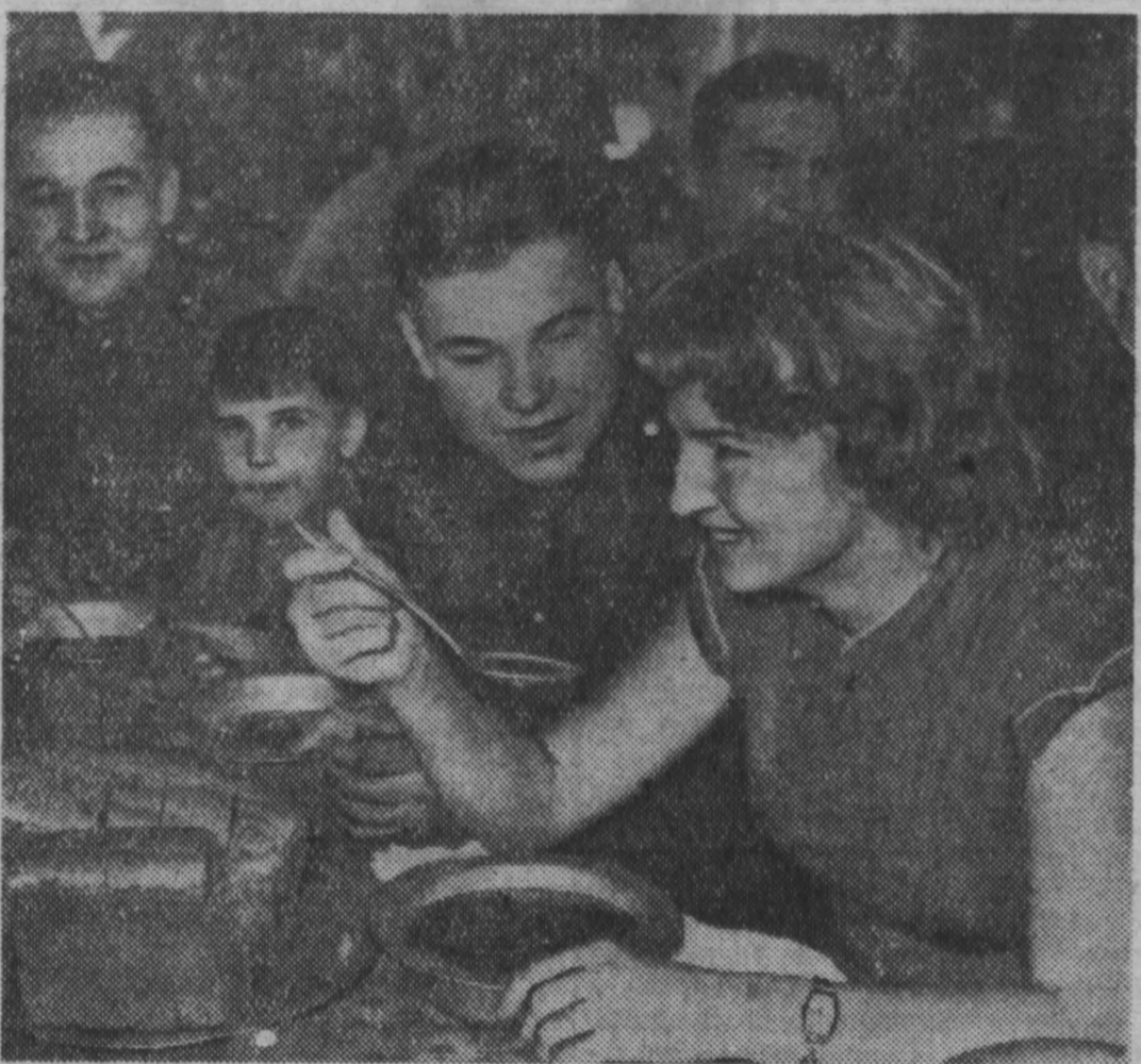
В Н-СКОЙ ЧАСТИ состоялась встреча воинов с участниками гражданской и Великой Отечественной войн, школьниками, работниками Хабаровской швейной фабрики № 2.