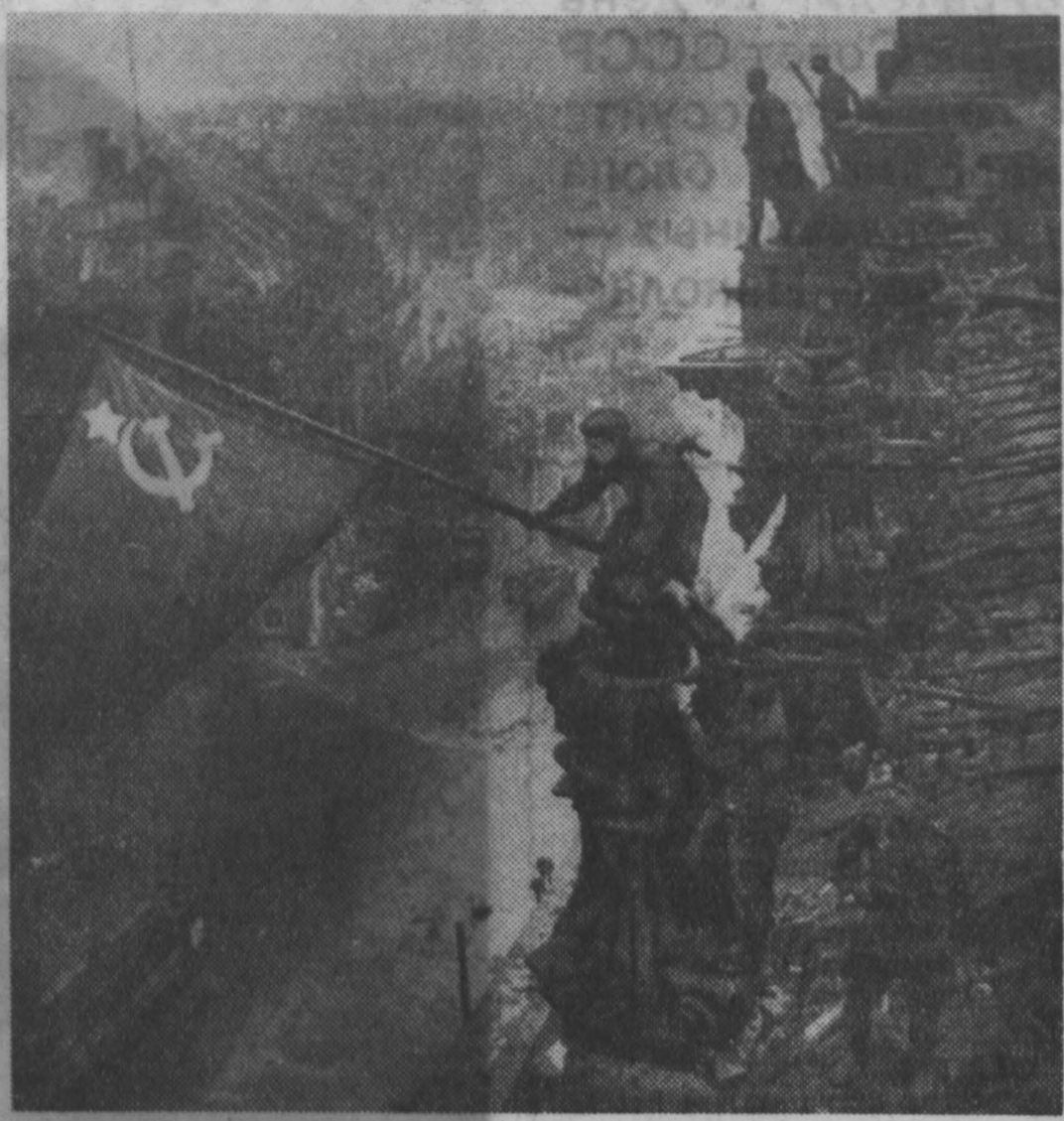
1945 год. Берлин. Знамя победы над рейхстагом.

На героических традициях гражданской войны росли и воспитывались новые замечательные кадры советских полководцев, славных ко-