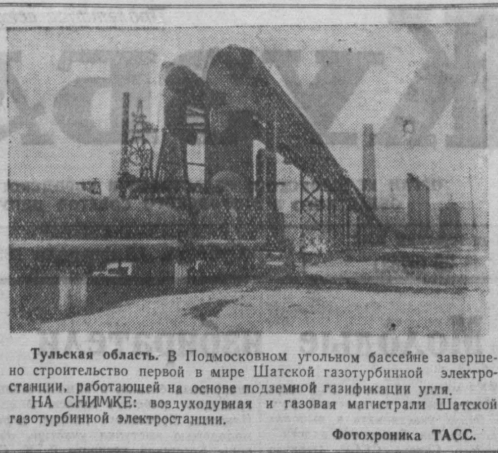
Тульская область. В Подмоскonnом угольном бассейне завершено строительство первой в мире Шатской газотурбинной электростанции, работающей на основе полуметрической газификации угля. НА СНИМКЕ: воздушная и газовая магистрали Шатской газотурбинной электростанции. Фотохроника ТАСС.

В 1957 году государственный план заготовок и закупок молока выполнен на 100,5 процента. Еще более успешно выполнен в прошлом году государственный план заготовок и закупок зерна. Однако план заготовок и закупок мяса, яиц и шерсти в 1957 году не выполнен.