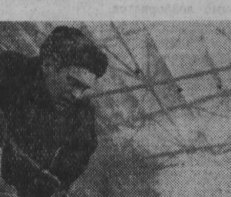
В этом году строители готовятся к пуску первой очереди Томусинской ГРЭС.

Встреча день выборов в Верховный Совет ССРСР, монтажники, слесари и электромонтажники в сложных зимних условиях добиваются хороших производственных показателей.