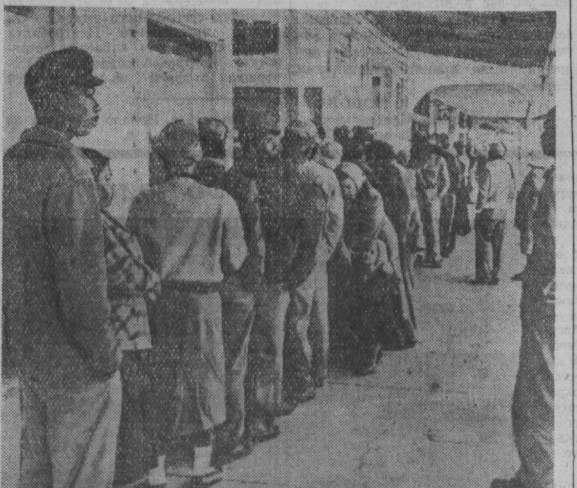
Соединенные Штаты Америки. По сообщению агентства Ассошиэтед Пресс, неблагоприятные климатические условия нынешней зимы во Флориде вызвали безработицу колющих сельскохозяйственных рабочих. Им и их семьям приходится часами стоять в очередях за питанием, которое предоставляется местными церковными организациями и благотворительными обществами.

Агентство указывает, что такая очередь, достигшая 1.800 человек, напоминает огромные очереди за хлебом, имевшие место во время кризиса 30-х годов.