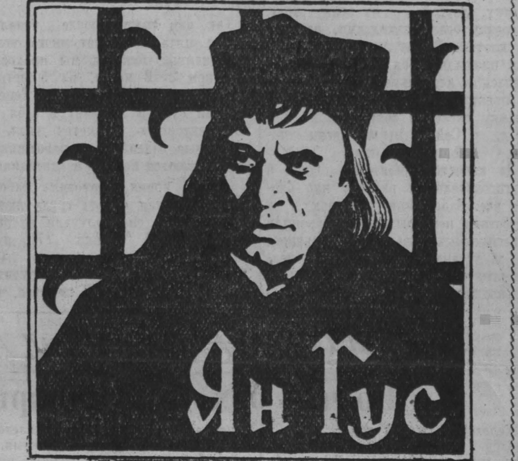
(по мотивам произведений Алоиза Ирасека)

Авторы сценария: М. Крадохил, О. Вавра. Режиссер О. Вавра. Оператор В. Гауш. Художники К. Шварц, И. Трнка, В. Смыра. Композитор И. Срика. Роли исполняют: З. Шпеланек, О. Крейча, В. Матулова и др. Производство киностудии «Чехословацкий государственный фильм», Прага. Выпуск 1955 года. Фильм дублирован на киностудию им. Горького.