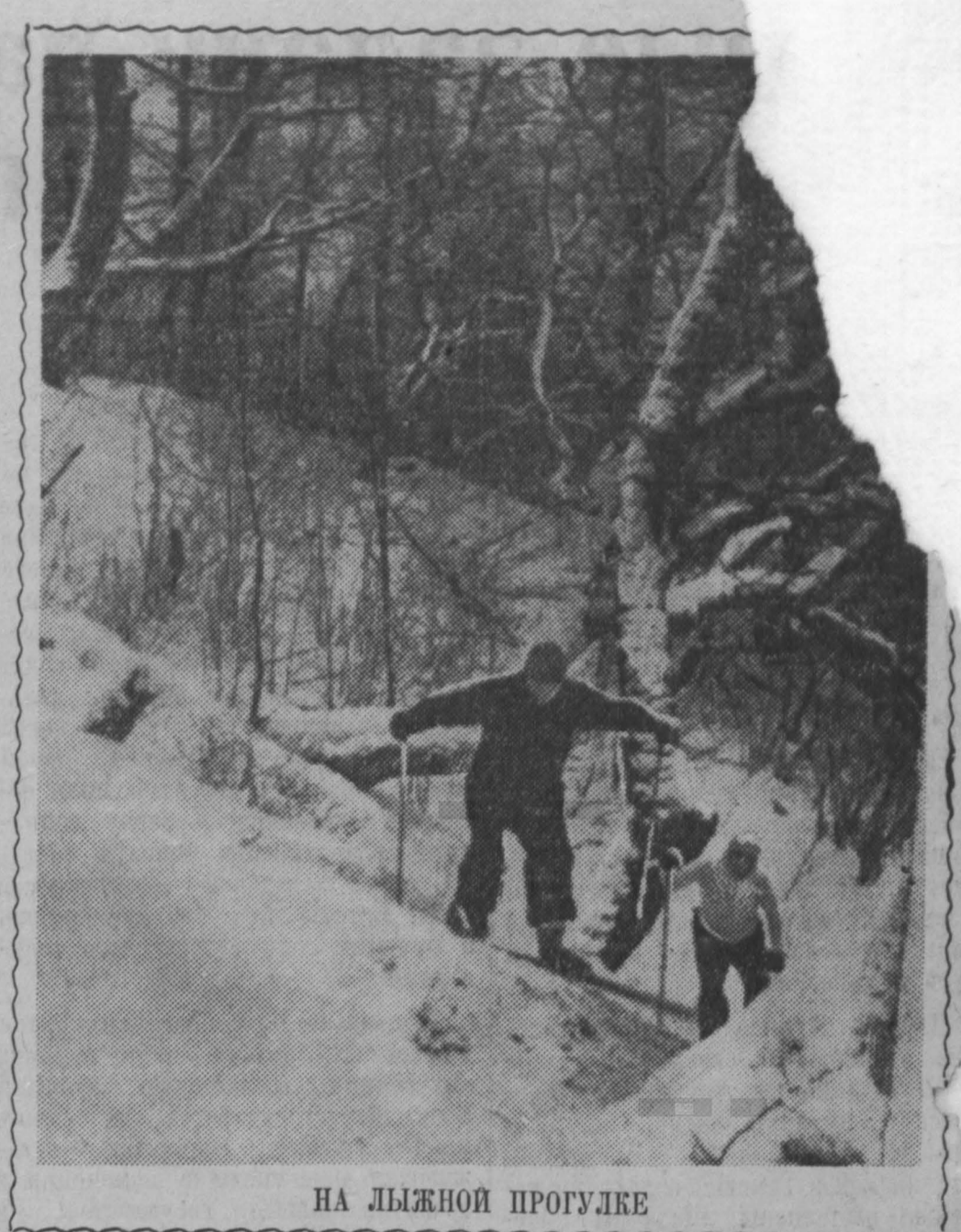
НА ЛЫЖНОЙ ПРОГУЛКЕ

КОЛОМНА (Московская область), 30 декабря. (ТАСС). Сегодня работники завода имени Куйбышева закончили изготовление двигателя первого советского газотурбовоза — газотурбинной установки мощностью в три тысячи лошадиных сил.