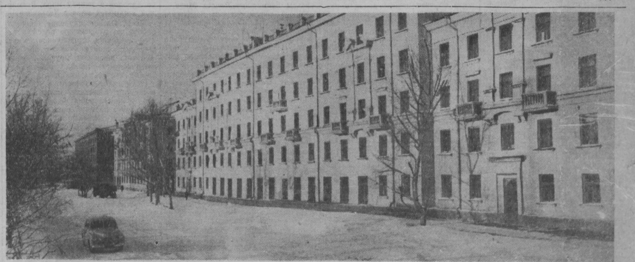
В больших масштабах ведется жилищное строительство в областном центре Кузбасса — Кемерово. Из года в год увеличиваются жилищные условия кемеровчан. Только в 1957 году в новых домах трудящиеся Кемерова получили свыше 120 тыс. кв. метров жилой площади. НА СНИМКЕ: жилые дома по улице Сталина, сданные в эксплуатацию в 1957 году.

Подводя итоги, горняки «Шушталенской-1» в казань нового года послали письмо работникам шахты