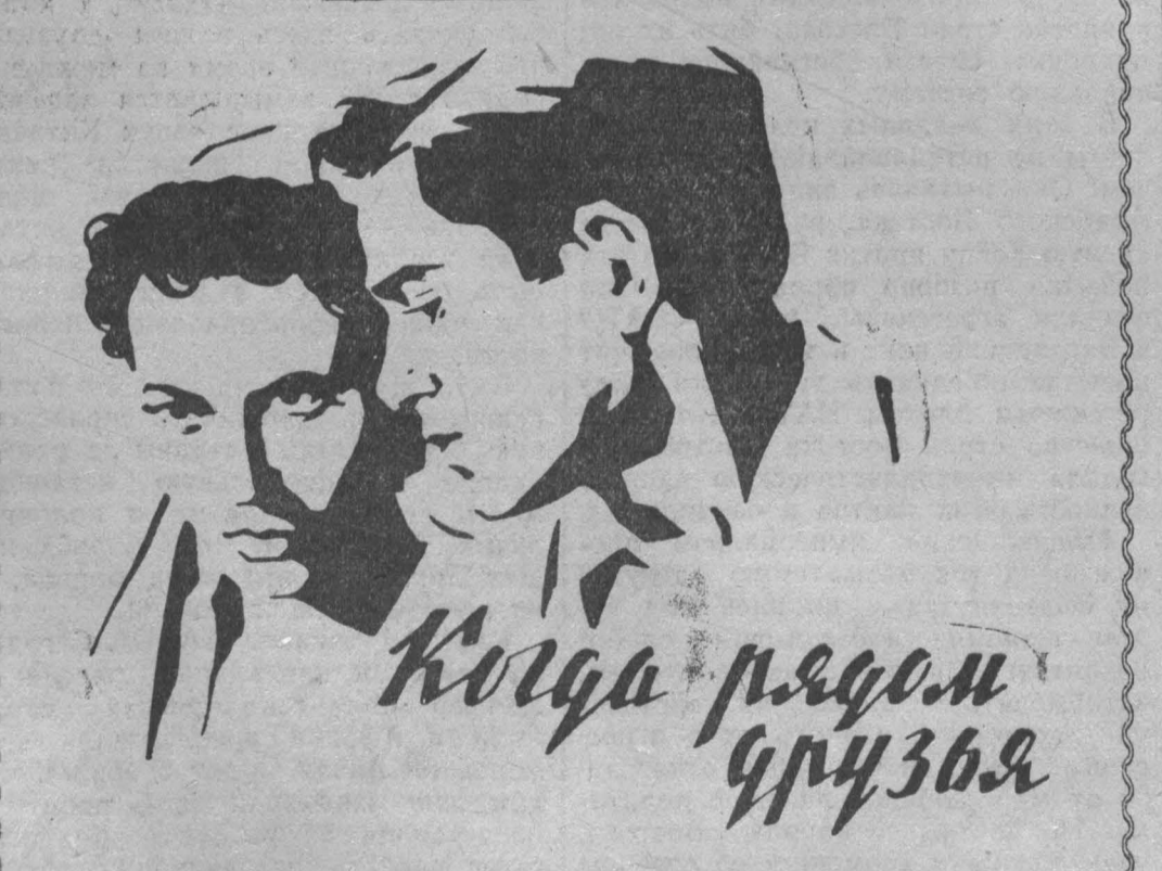
Когда рядом друзья

КОГДА ЛЮБИШЬ Авторы сценария Канато Синдо, Юсюку Ямагата. Режиссеры Кинисабуро Юсимура, Тадаши Имаи, Саюю Ямамото. Операторы Иосино Миядзима, Сюнитиро Накао, Такэо Ито. Композитор Масао Оки. Производство компании «Докурицу Эйга», Япония. Фильм дублирован на киностудии имени М. Горького. Режиссер дублиража Э. Волк. Звукооператор М. Шмелев. Выпуск 1957 года.