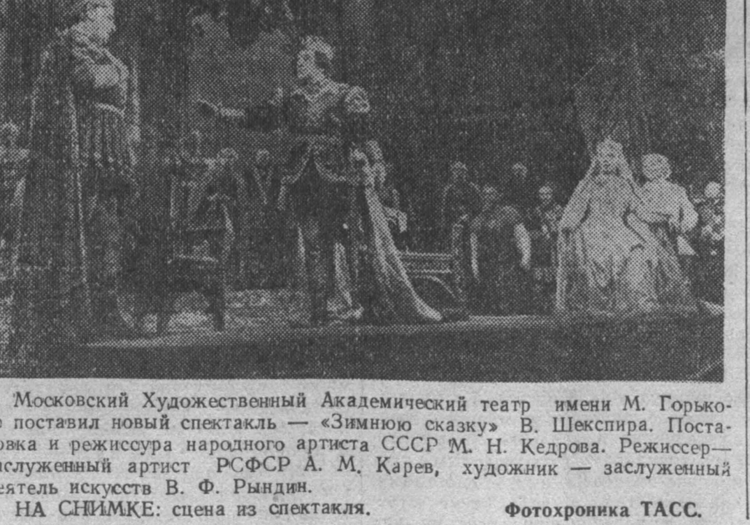
Московский Художественный Академический театр имени М. Горького поставил новый спектакль — «Зимнюю сказку» В. Шкелера.

«Эстафета, посвященная выборам в Верховный Совет СССР В Таджикистане началась эстафета учреждений культуры, посвященная выборам в Верховный Совет СССР.