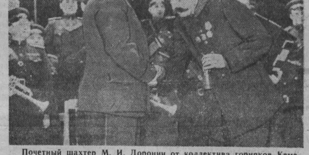
Почетный шахтер М. И. Дорони от коллектива горняков Кемеровского рудника вручает художественному руководителю ансамбля заслуженному деятелю искусства РСФСР, композитору А. Новикову шахтерскую лампочку.