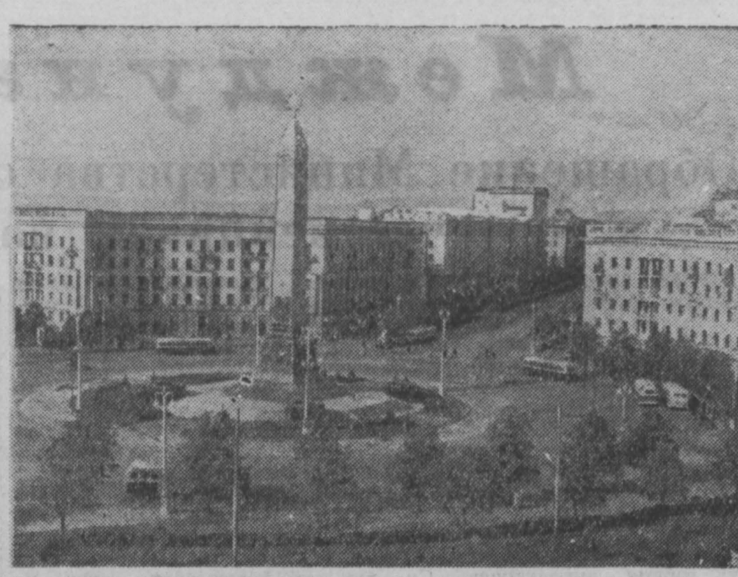
МИНСК. Круглая площадь. В центре — памятник советским воинам и партизанам. Фотохроника ТАСС.