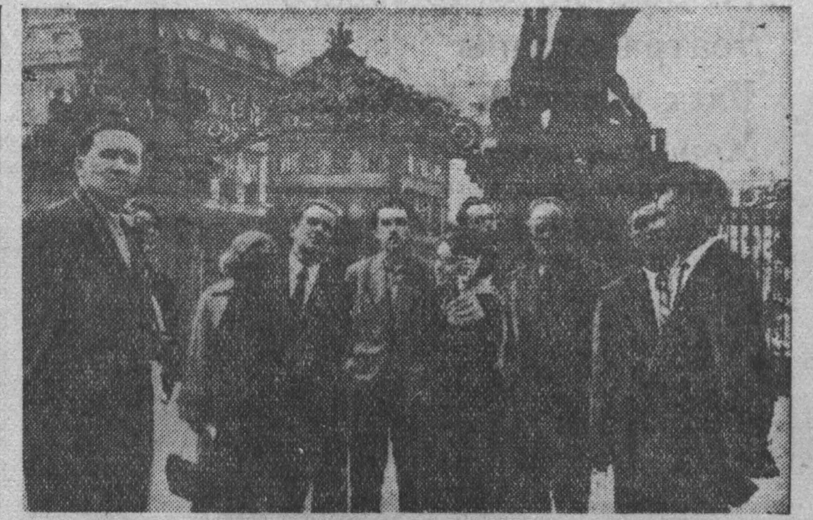
Недавно группа советских туристов на собственных автомашинах путешествовала по Чехословакии, Польше и Германской Демократической Республике...