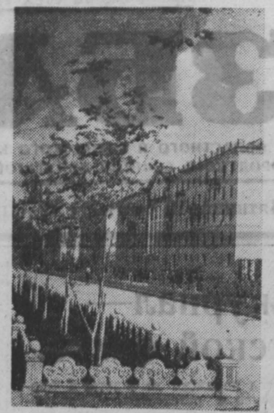
Междуреченск сегодня. Коммунистический проспект.

В. ПЛЕСОВСКИЙ. (Спец. корр. «Кузбасса».) Промышленковский район.