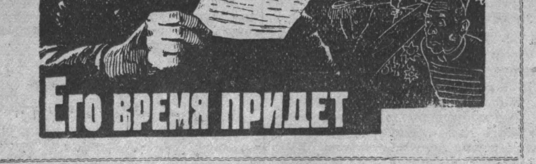
Его время придет