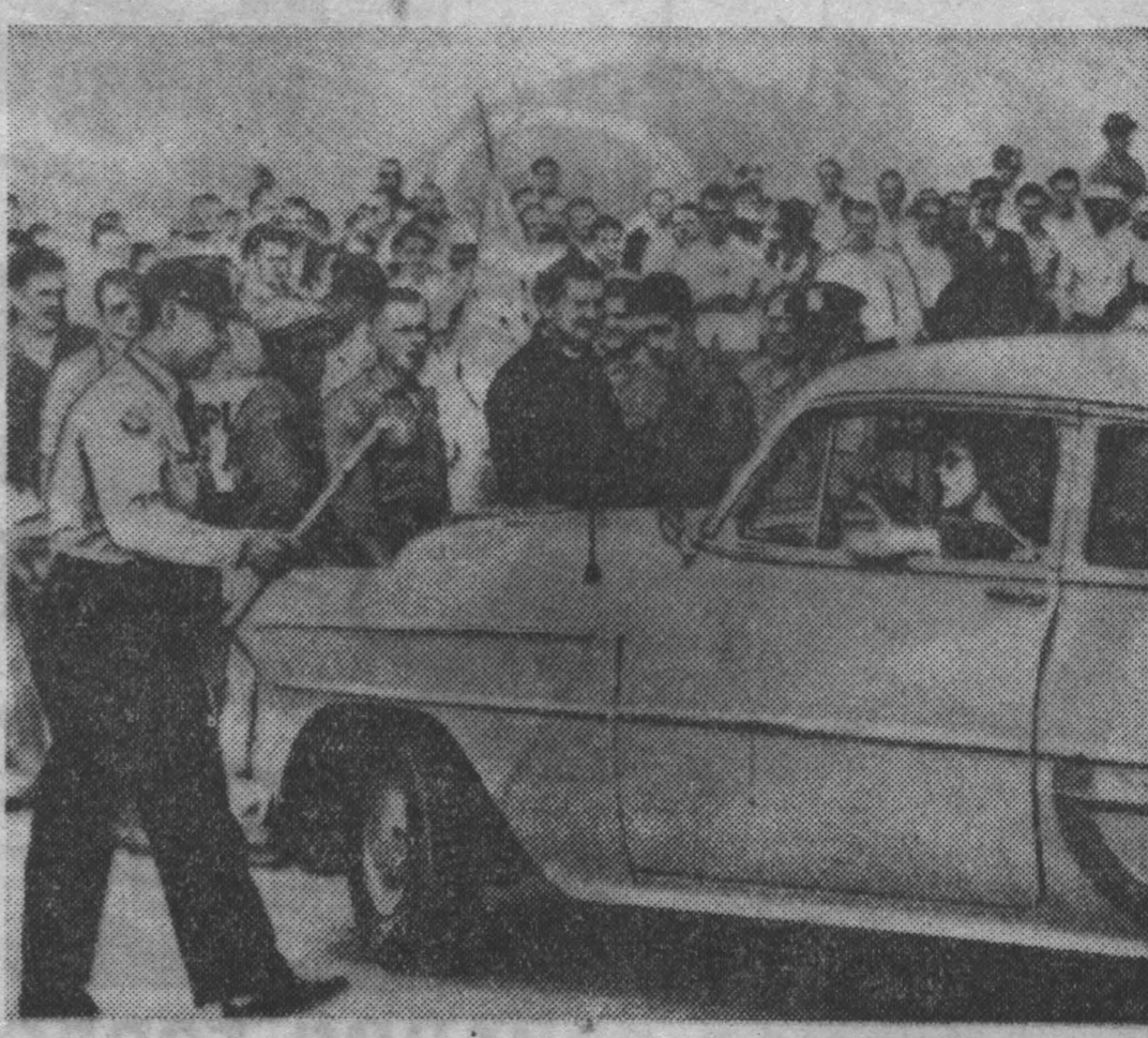
Соединенные Штаты Америки. В конце июня в Детройте на заводе компании Крайслер по производству ракетных снарядов «Редстоун» и «Юпитер» вспыхнула забастовка. Ее участники выставили пикеты у ворот предприятия, которые задерживали направляющихся на работу. НА СНИМКЕ: полиция пытается пропустить автомобиль через пикет.

Затем представитель Швеции Ярринг предложил проект резолюции о временном прекращении деятельности наблюдателей ООН в Ливане. Он еще раз заявил при этом, что интервенция США в Ливане — это коренным образом изменила обстановку и что интервенция США в Ливане — это коренным образом изменила обстановку.