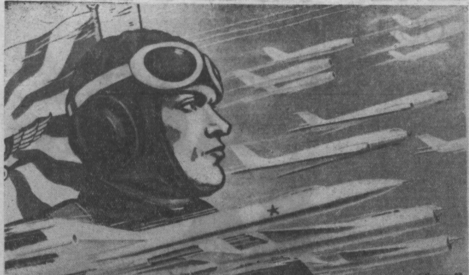
СОВЕТСКАЯ АВИАЦИЯ — ГОРДОСТЬ НАРОДА!