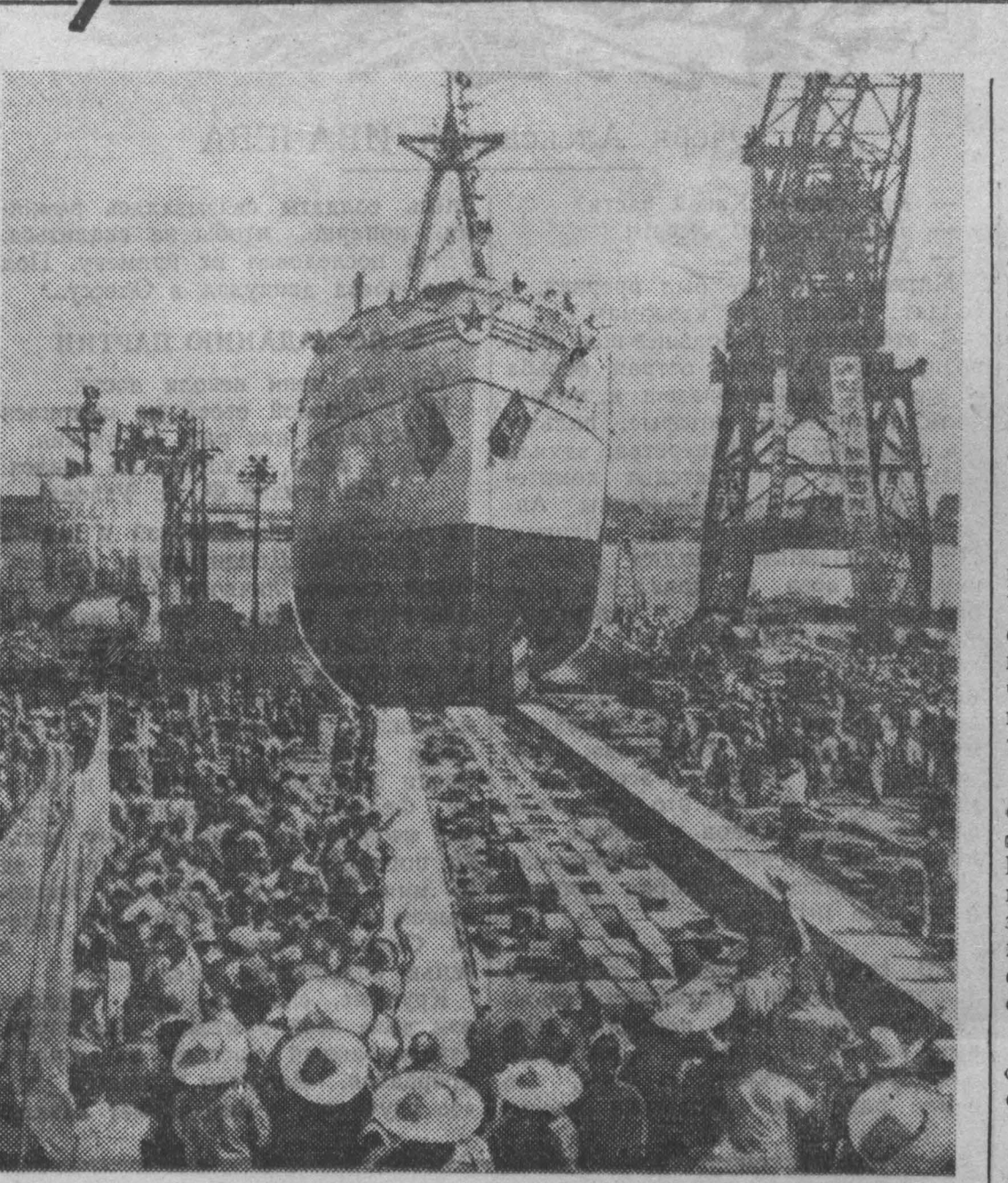
Китайская Народная Республика. В Шанхае спущен на воду новый корабль «Мир 28». Он был построен всего за 83 дня, в то время как обычно такие суда строятся 18 месяцев. НА СНИМКЕ: спуск на воду нового судна.

ПРАГА. (ТАСС). Как сообщает Чехословацкое телеграфное агентство, в связи с предстоящим Стокгольмским конгрессом за разоружения и международное сотрудничество генеральный секретариат Международной организации журналистов опубликовал сегодня обращение к журналистам всего мира, в котором призывает их стать глашатаями мира и дружбы между народами всех стран, отдать все свои силы делу служения счастью человечества. Почетный и исторический долг всех демократических журналистов, говорится в обращении, присоединиться к голосам людей всех континентов и отдать все свои силы и способности делу служения гуманизму и светлому будущему. Пусть же печать станет мощным оружием всех людей доброй воли, требующих самого простого и в то же время самого великого на свете — мира и дружбы!