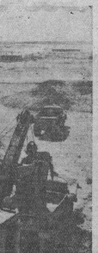
Китайская Народная Республика. Полным ходом идут строительные работы на железнодорожном месторождении Байноном, которое будет снабжать рудой строящийся металлургический комбинат в Баоту.

С докладом по первому вопросу повестки дня «Борьба за обеспечение мира и за победу социализма» выступил Первый секретарь ЦК СЕПГ В. Ульбрихт.