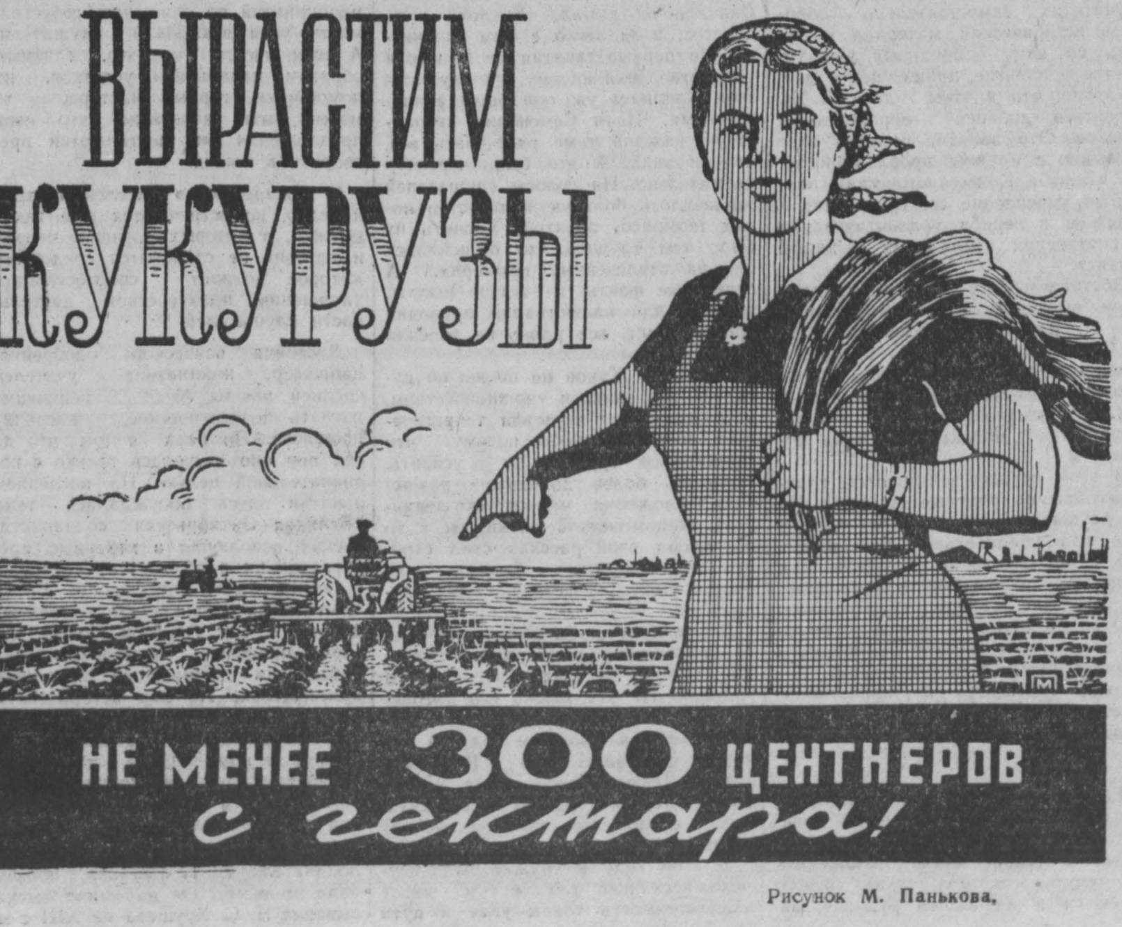
Рисунки М. Панькова.

Министерство просвещения РСФСР рассматривает вопрос о подготовке кадров учителей для школ Сибири и Дальнего Востока. Министром просвещения автономных республик, а также заведующим краевыми и областными управлениями народного образования Сибири и Дальнего Востока разрешено, начиная с этого года, направлять для обучения в педагогические институты Европейской части РСФСР местную молодежь, преимущественно из сельских районов. Предполагается, что после окончания вузов молодежь специалисты будут направлять-