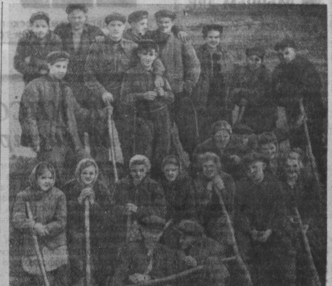
Строители колхозного птичника — ученики 9-го класса «А» Полудской средней школы.