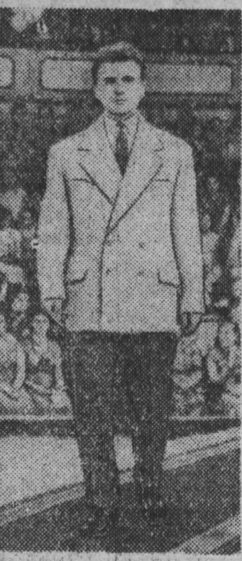
Мужской спортивный костюм модели В-1133.