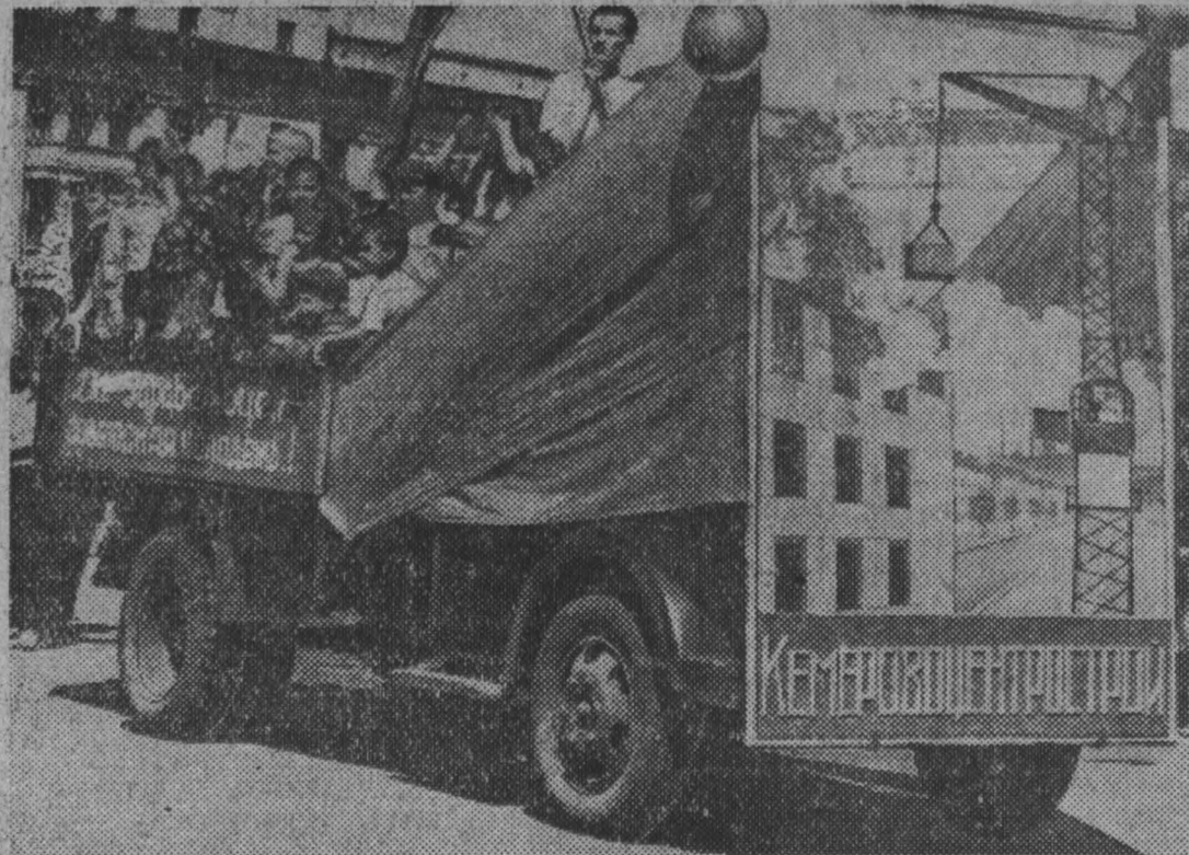
На снимках: празднование Дня советской молодежи в Кемерове.