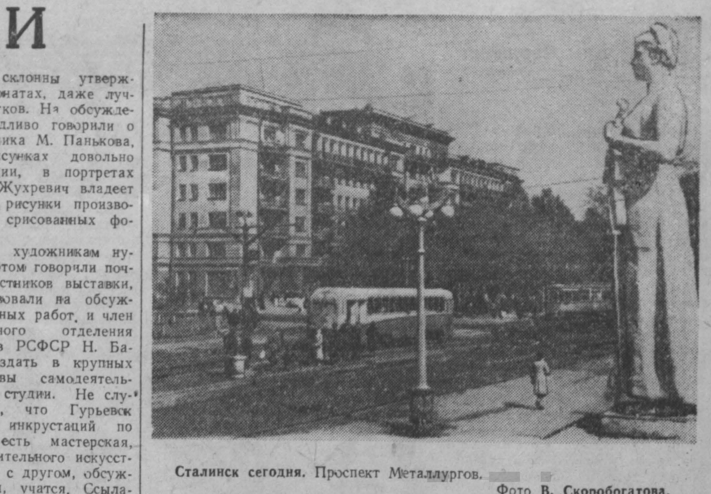
Сталинец сегодня. Проспект Металлургов.

Во дворе дома № 5 по проспекту Металлургов в г. Сталине, разбитый кем-то мостик городской пионерской организации, организованной при поддержке Коммунарки Кузнецкого комбината.