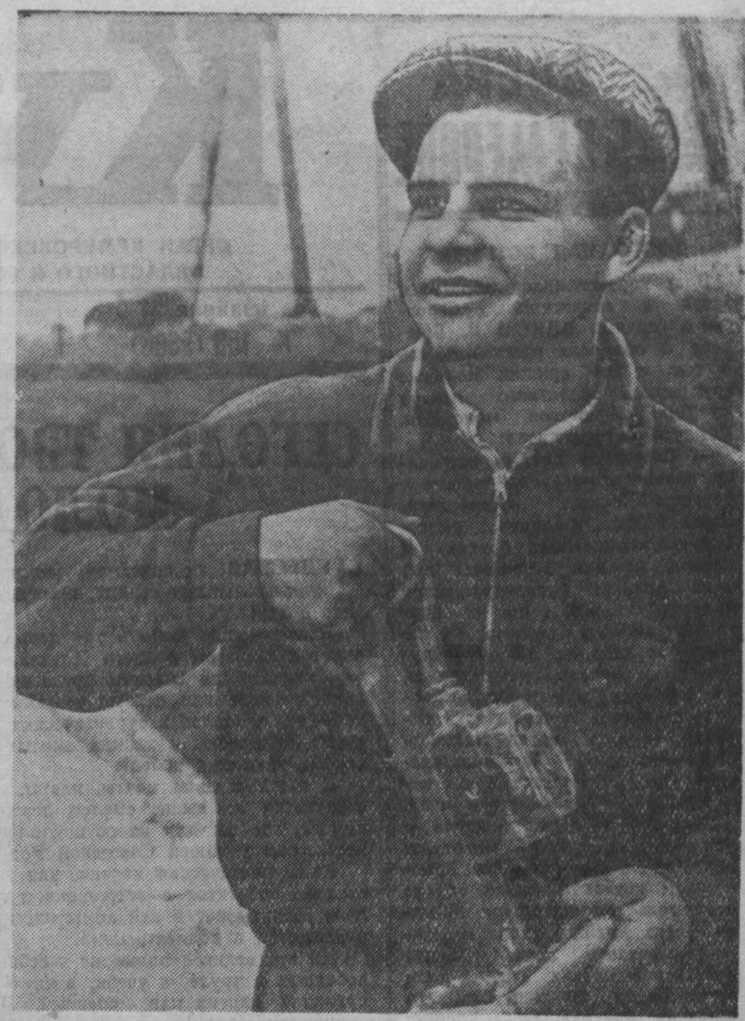
Строительство Западно-Сибирского металлургического завода объявлено комсомольской стройкой. Много юшей и девушек приехало на Анжеро-Судженскую площадку, чтобы своими руками построить новый гигант черной металлургии.