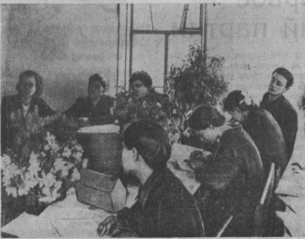
К своим сверстникам напечатала промышленновская районная газета «Красное знамя».

В финале первенства намечалось провести состязания в гонках по пересеченной местности (кросс), но в связи с ненастной погодой, которая сделала трассу совершенно непроходимой, судейская коллегия вынуждена была их отменить.