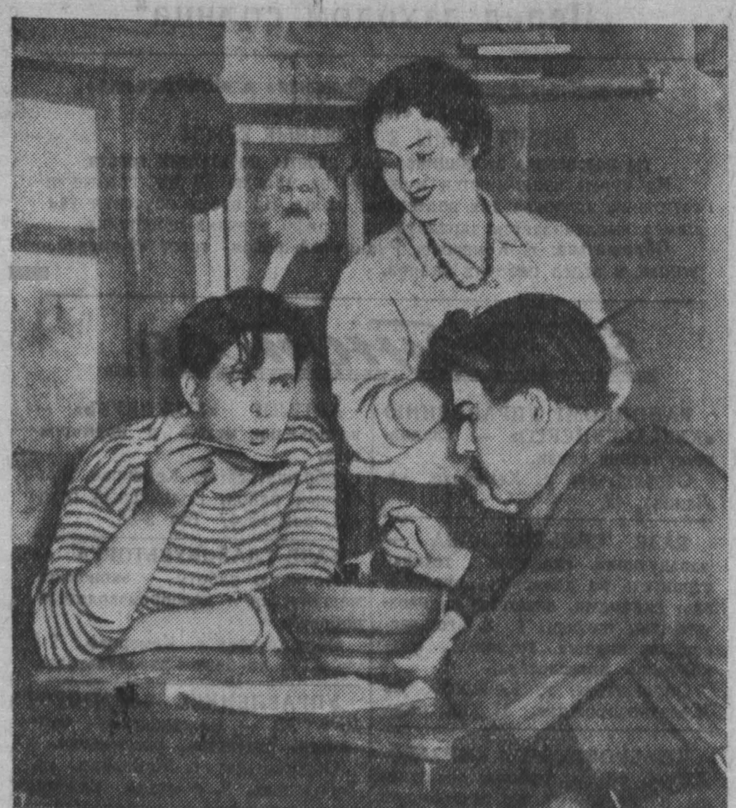
Гастроли Томского драматического театра имени Чкалова

Это диктаторское правительство было навязано Франции переворотом в Алжире и Аяччо, угрозой вооруженного вмешательства мятежных генералов и штабс-командиров алжирской войны. Нельзя под влиянием законности скрывать действительный характер государственного переворота, и депутаты, которые согласились на это самоотречение, изменили мандат, который был дан им народом, и отреклись от республики».